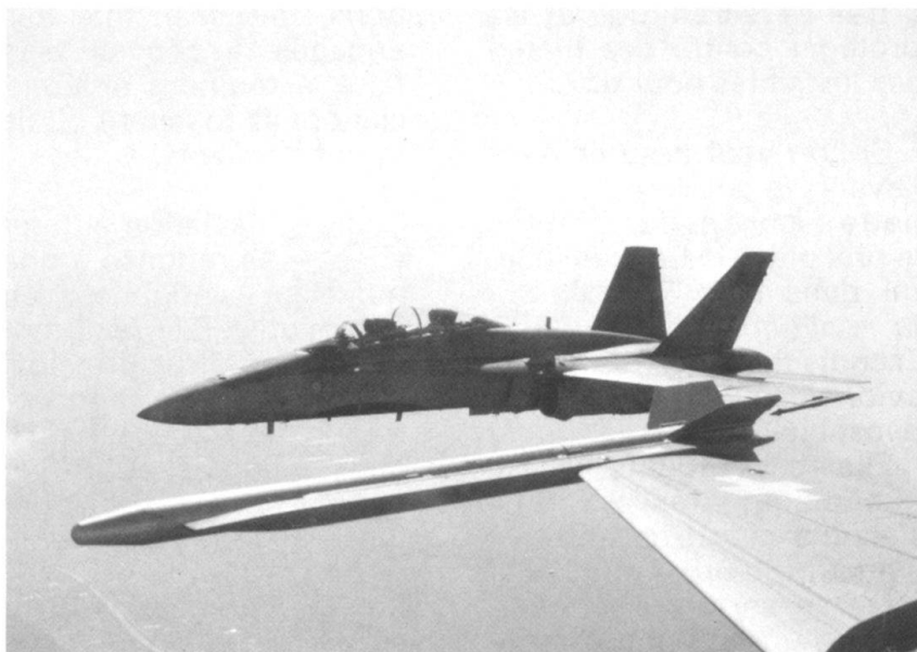
Mai 1988, évaluation du F/A-18 en Suisse: F/A-18 en formation avec un F-5F Tiger, dont on aperçoit le bout de l'aile

Le débat parlementaire, et même national, qui se déroulera autour du F/A-18, engagera bien plus que le choix d'un type d'avion et l'achat de 34 appareils.