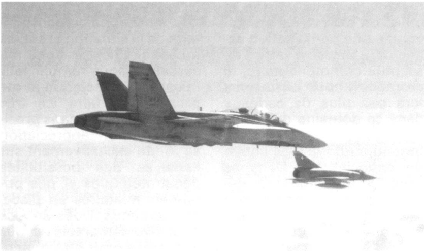
Mai 1988, évaluation du F/A-18 en Suisse: F/A-18 biplace en formation avec un Mirage III S (CADCA)

che, et peut-être demain avec la Hongrie, ce fameux «corridor des neutres», qui sépare en deux les forces armées de l'OTAN, les obligeant à de vastes détours, sur terre comme dans les airs.