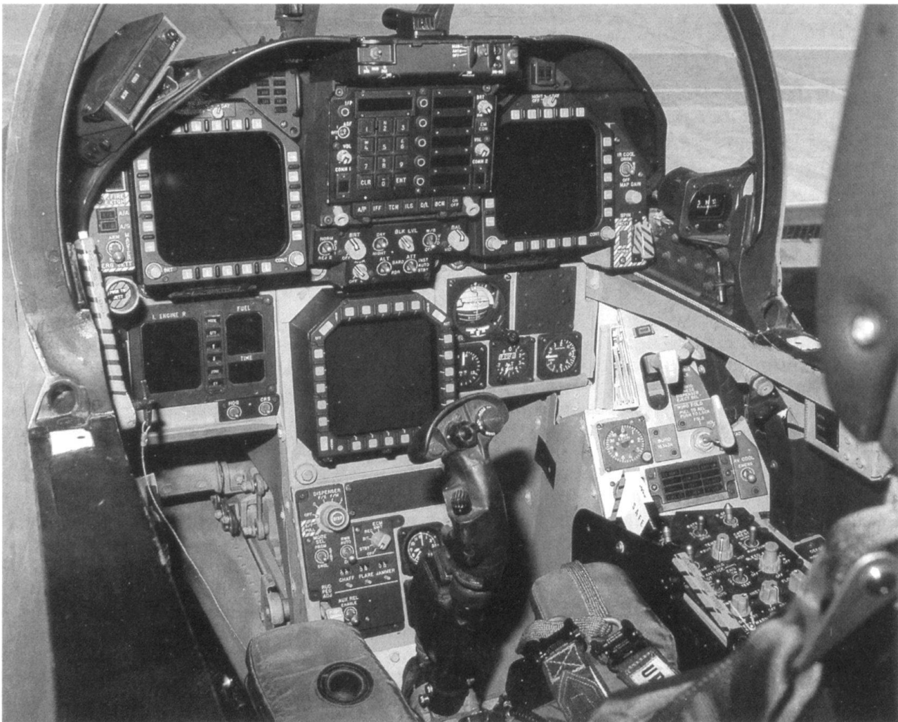
Vue sur le cockpit. Pour le vol de nuit, le pilote reçoit une image TV, fournie par un senseur IR. Il peut aussi piloter avec des lunettes de vision nocturne (McDonnell Douglas)

On met en cause la nécessité d'acquérir un nouvel avion, et il est notoire que beaucoup sont effrayés par le montant de l'investissement à consentir pour si peu d'appareils.