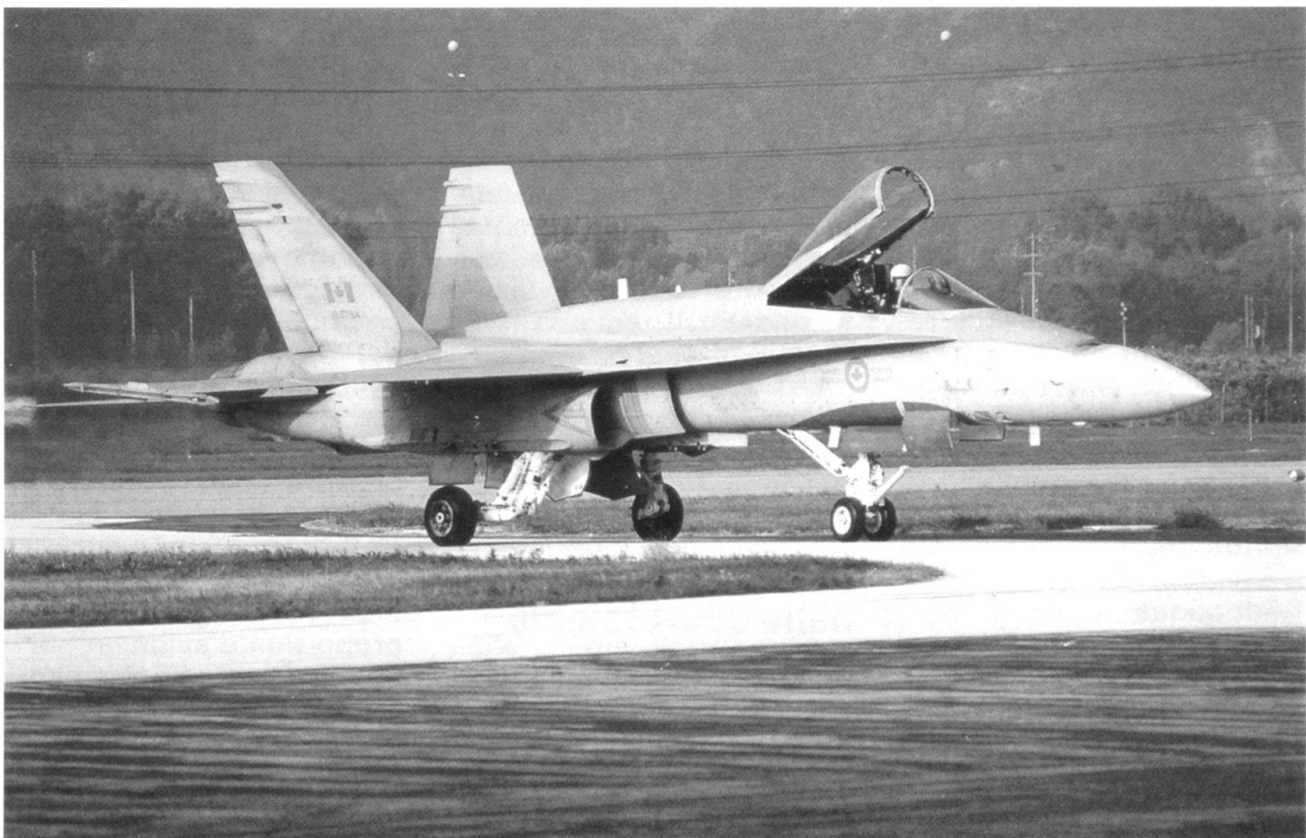
F/A-18 canadien sur l'aérodrome de Sion (CADCA)

Sur le plan géostratégique, la Suisse forme, avec l'Autri-