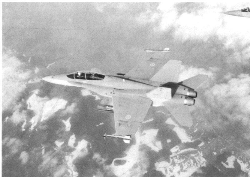
Mai 1988, évaluation du F/A-18 en Suisse: F/A-18 au-dessus des Alpes

«Où est l'ennemi?...» tonitruent certains prophètes qui n'ont pas su dire hier de quoi aujourd'hui serait fait, mais qui affirment avec conviction que notre armée est désormais inutile, puisqu'il n'y a plus de conflit à l'horizon.