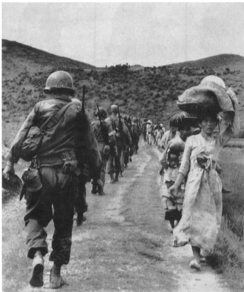
Toute la Guerre de Corée en une seule image. Une colonne américaine en marche vers le front croise des civils en fuite. Juin 1950.

Rapidement, les ennuis commencent. Rappelons qu'à cette époque, les «neutres» polonais et tchécoslovaques étaient aussi tenus à la «solidarité prolétarienne». Les Américains, se basant sur leurs observations aériennes, accusent le Nord d'importer du matériel par des voies autres que celles spécifiées dans l'AA. En 1956, l'UNC exige le retrait des NNIT basées au Sud. Dès lors, le Nord renvoie aussi les équipes d'inspection établies sur son territoire. En 1957, les Américains, pour les mêmes motifs, décident de suspendre unilatéralement leurs communications prévues à l'art. 13 d) AA, concernant le renforcement du potentiel militaire au Sud, à titre provisoire, disent-ils. Dès cette