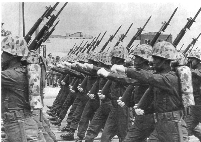
L'armistice signé, les deux Etats coréens n'en poursuivent pas moins leurs préparatifs militaires. Défilé du 14 e anniversaire de la République de Corée, en 1962.

Quelles sont les raisons de cette décision de la KPA/CPV? La Corée du Nord avait clairement fait connaître son opposition à la nomination, début 1991, d'un général sud-coréen comme Senior Member de l'UNC dans la Military Armistice Commission en remplacement des officiers généraux américains qui se sont succédé