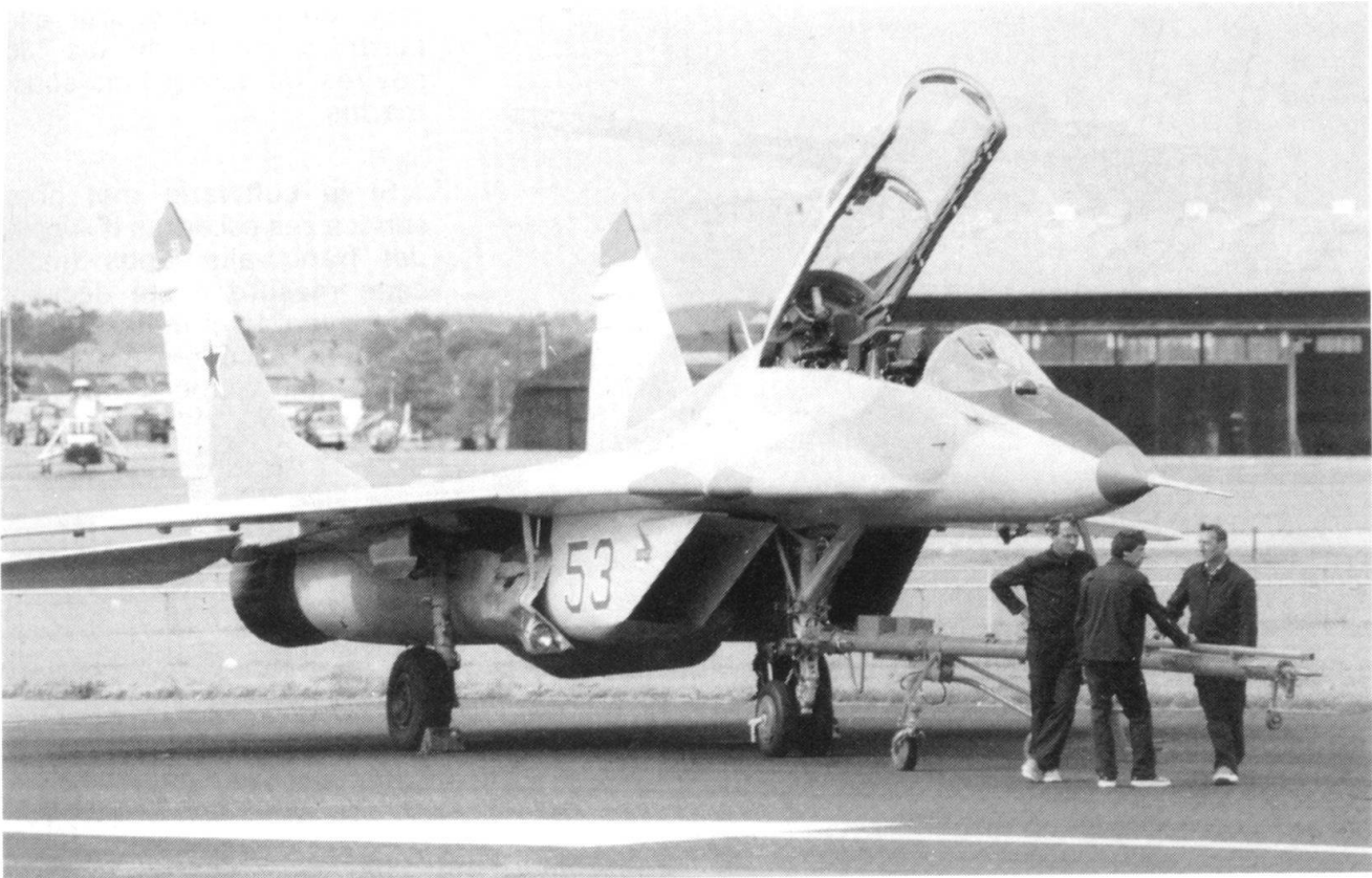
Un «Mig-29» de l'armée est-allemande.

Sans doute est-il trop tôt pour mesurer toute l'étendue des bouleversements sur la scène européenne depuis deux ans, et les responsables allemands ne sont pas les seuls à manquer de concepts nouveaux et d'une vision cohérente du futur. Tous les gouvernements, de Washington à Moscou en passant par