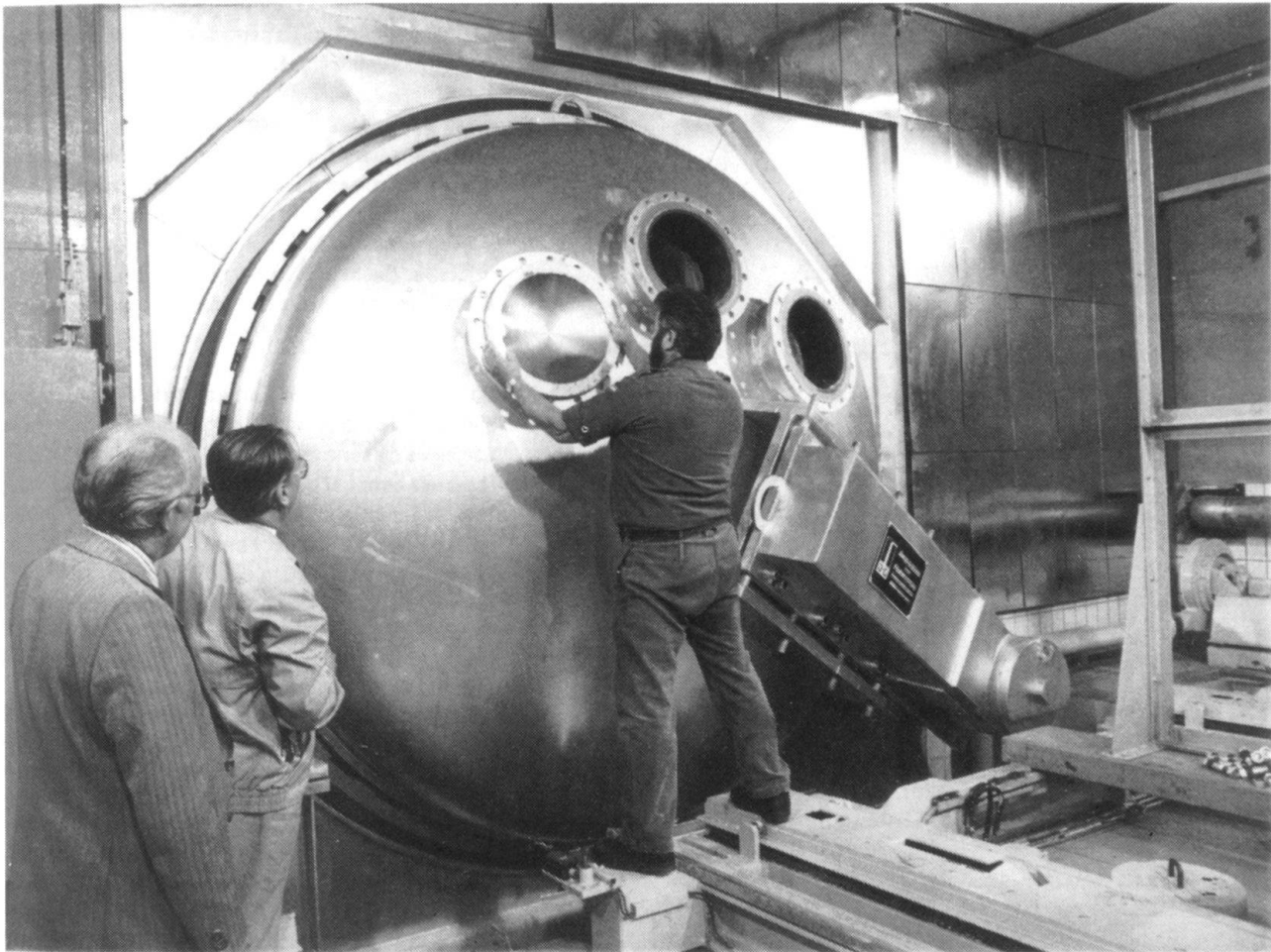
Depuis juin 1990, la Bundeswehr dispose à Munich d'une installation capable d'incinérer les toxiques de combat. La porte d'acier de la chambre de combustion pèse neuf tonnes. A l'intérieur, on peut obtenir une température de 1200 degrés. Coût du système: 20 millions de marks.

mement, dont l'activité décline avec la diminution du nombre de contrats. Les 40 000 personnes ayant travaillé dans l'armement de l'ancienne RDA ont été licenciées et, à l'Ouest, une grande partie des 130 000 emplois directement liés à l'industrie (280 000 en comptant les sous-traitants, etc.) sont menacés. Déjà pour l'année en cours, le budget d'équipement de la Bundeswehr (recherche et développement compris) a été ramené à 6 milliards de marks et tous les grands programmes d'armement sont remis en question. Il est peu probable que le fameux chasseur 90, projet tri-