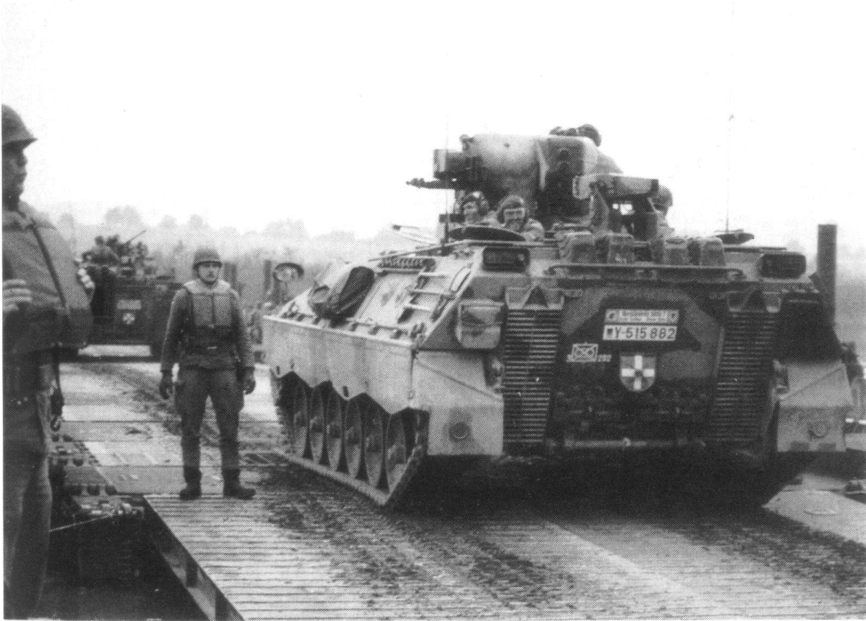
Confié à un équipage de quatre hommes et doté d'une tourelle à deux places, le «Marder MICV» peut transporter un détachement de six fantassins. Tous les «Marder» doivent être équipés de missiles «Milan».

tion délicate du départ à la retraite anticipée de bon nombre d'officiers et de sous-officiers. Le ministre de la Défense avait prévu de diminuer le nombre des militaires de carrière et des engagés par rapport au nombre des appelés, afin d'alléger le fardeau financier des pensions et des indemnités. Mais la commission de défense du Bundestag, sur l'initiative de son propre parti, la CDU, a rejeté cette demande et décidé de maintenir le ratio actuel entre soldats de métier et appelés, ces derniers constituant 46% des effectifs totaux.