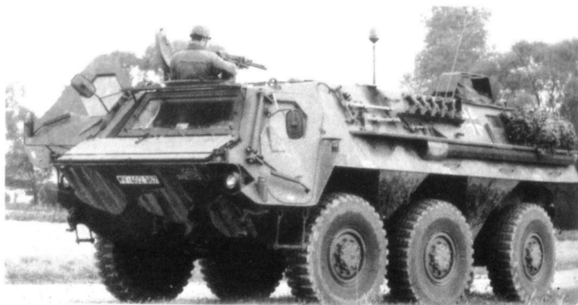
Le « Transportpanzer 1 » peut servir de poste de commandement et de transmissions mobiles et de plate-forme de guerre électronique.

Le corollaire de cette transformation, c'est bien entendu la «conversion» de l'appareil militaire sur trois plans distincts: d'abord les unités d'active, ce qui pose la ques-