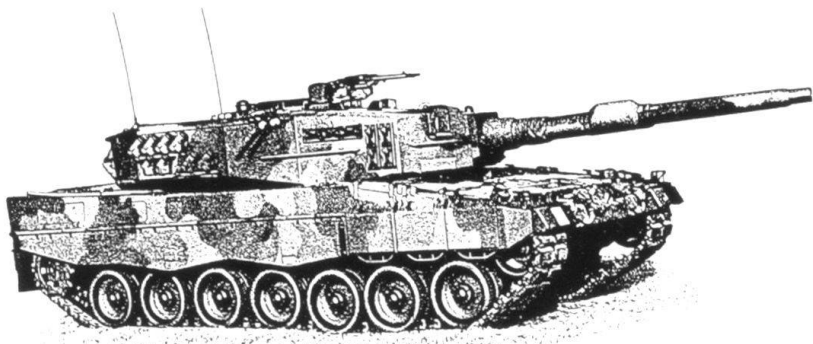
Le « Léopard-2 ». L'Allemagne a décidé d'arrêter sa fabrication.

uniforme), se plaignent que leurs supérieurs ne leur fournissent pas le soutien intellectuel indispensable pour motiver la troupe. Des slogans tels que «l'armée pour la paix» et une «Bundeswehr verte» (pour sauver l'environnement menacé) ne sauraient masquer le vide conceptuel.