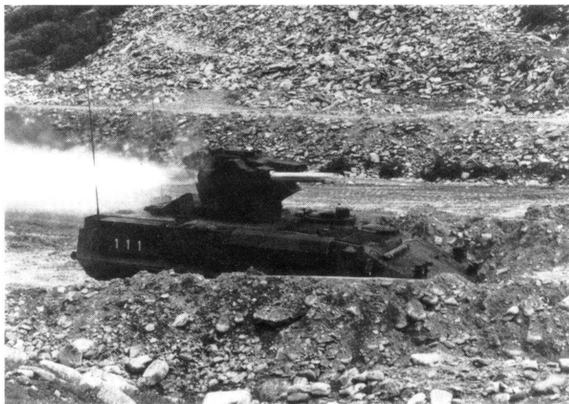
...Même situation pour les équipages des chasseurs de chars.

On reste songeur, surtout quand on sait qu'à l'école de recrues, l'instruction des équipages de Léopards et de Piranha ne dépassera pas le niveau de la section, que les restrictions budgétaires limiteront leurs déplacements sur route et par chemin de fer. Dans l'infanterie, «l'instruction ne sera plus possible à l'échelon bataillon, mais seulement jusqu'à celui de la compagnie renforcée (...). Dans d'autres domaines, il faudra emprunter la voie de la spécialisation de l'individu 9 .»