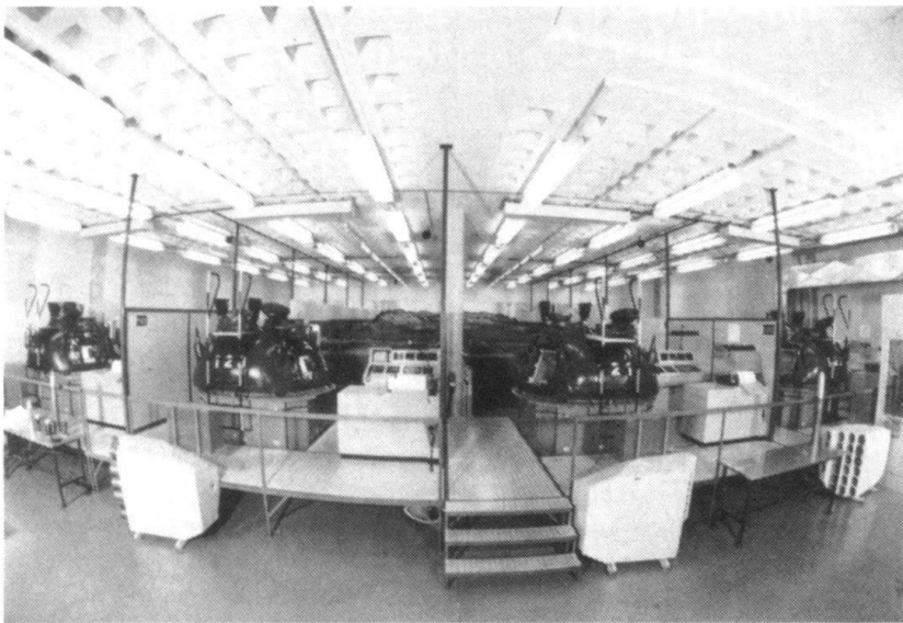
Le Concept d'instruction 95 prévoit que l'instruction des équipages de chars ne dépassera pas, durant l'école de recrues, le niveau de l'engagement de la section... Les compagnies, les bataillons ne seront donc pas immédiatement opérationnels après la mobilisation. Ici, le système de simulation de tir pour chars 68 à Thoune.