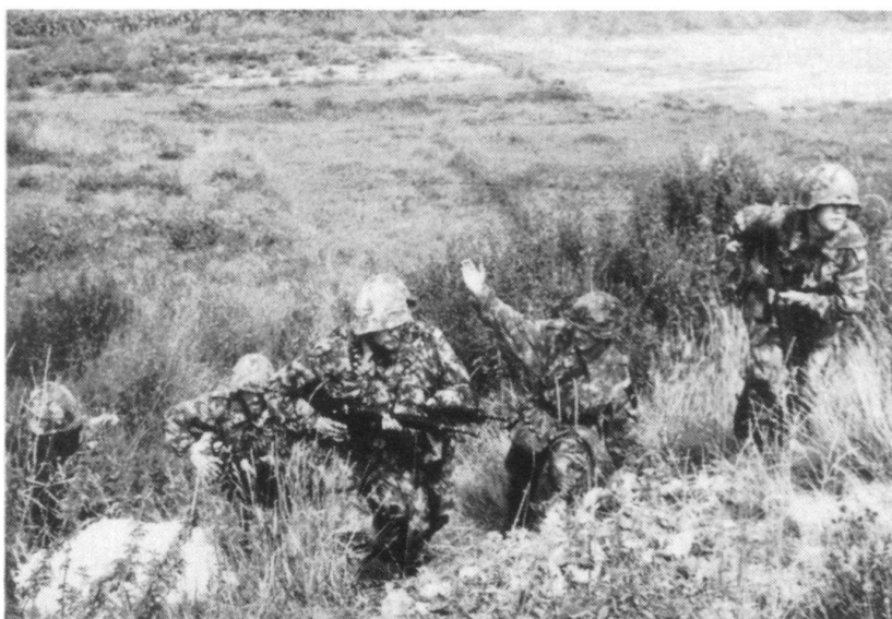
Les grenadiers de chars également n'iront pas au-delà des exercices de section à l'école de recrues...