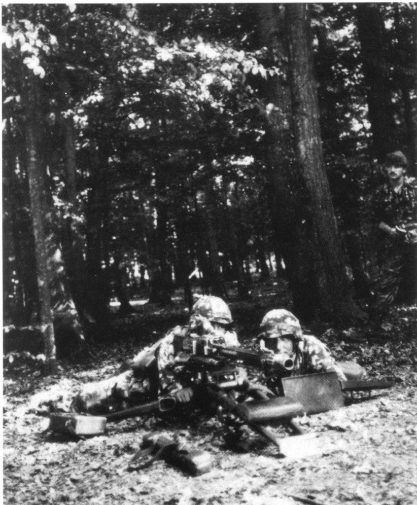
...et même pour nos braves fantassins. (Photo Paul Mülhauser).

Dans notre armée, on a de la peine à admettre que des normes ne peuvent pas s'appliquer d'une manière universelle; de plus, de petites jalousies entre les différentes armes sévissent à tous les niveaux. A partir des années 1970, n'a-t-il pas fallu deux décennies pour que fantassins, tankistes et artilleurs collaborent sans arrière-pensées? Beaucoup de problèmes restent sans solution, parce que, dans l'esprit des bureaucrates de l'administration militaire, tout le monde doit être mis sur le même pied, bien que la matière d'instruction d'un fantassin, d'un soldat de chars ou d'un pilote ne soit pas forcément identique! A l'époque héroïque de la cavalerie, les dragons effectuaient officiellement une école de recrues rallongée de quinze jours (19 semaines au lieu de 17), afin de se familiariser avec le cheval qu'ils avaient acquis au cours de la dix-septième semaine. Il n'était pas question que ce «supplément» soit soustrait aux cours de répétition!