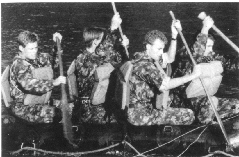
Il importe de savoir tout faire!

peut acheter à boire et se sécher, tandis que les officiers calculent les points; au dernier tir, déjà, une vingtaine de squads ne sont pas arrivés avant l'heure de fermeture et, pour ceux qui ne totalisent pas 1000 points à ce stade, c'est le rembarquement vers la vallée... Après le break, on enregistre aussi quelques abandons: dans la chaleur, l'idée de repartir dans la tourmente pour 10 km supplémentaire en montagne paraît inacceptable à quelques-uns. De plus, le toubib a fort à faire avec les ampoules et bobos en tous genres.