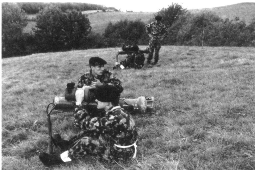
Au menu des épreuves, tir au simulateur efa...