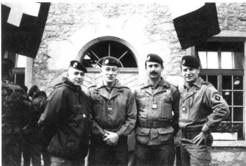
... comme d'ailleurs de fraterniser avec des officiers étrangers.

Cette édition 1991, qui comportait 60 km de terrain, est la plus dure à laquelle nous ayons assisté, et il ne fait aucun doute dans l'esprit des participants que les organisateurs ont programmé la neige: pluie et vent en bas, et Bérézina en haut! Le nombre de patrouilles qui ont réussi l'ensemble de la mission, soit 45 sur 95, en dit long, et c'est la première fois que nous voyons tant d'éclipsés à la remise des prix!