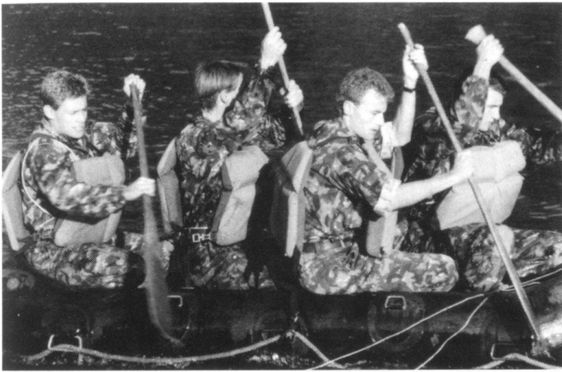
Il importe de savoir tout faire!

peut acheter à boire et se sécher, tandis que les officiers calculent les points; au dernier tir, déjà, une vingtaine de squads ne sont pas arrivés avant l'heure de fermeture et, pour ceux qui ne totalisent pas 1000 points à ce stade, c'est le rembarquement vers la vallée... Après le break, on enregistre aussi quelques abandons: dans la chaleur, l'idée de repartir dans la tourmente pour 10 km supplémentaire en montagne paraît inacceptable à quelques-uns. De plus, le toubib a fort à faire avec les ampoules et bobos en tous genres.