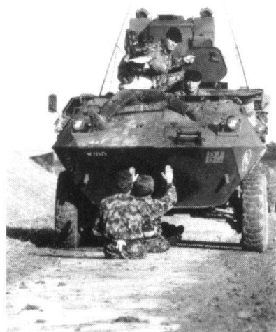
... et passage sous un Piranha lancé à plus de dix kilomètres heure.

Embarquées dans des véhicules, les équipes sont amenées aux Pradières, chalet d'alpage devenu militaire; les camoins montent dans une véritable tempête de neige, la couche atteignant de 20 à 30 cm. Dans le chalet surchauffé, on