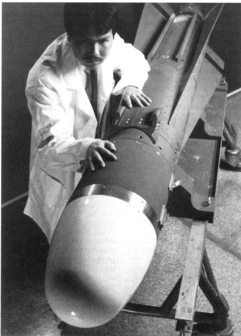
La prolifération de systèmes d'armes toujours plus sophistiqués dans des régions instables impliquent des risques pour l'Europe et pour la Suisse.

En effet, de telles considérations ont leur place au niveau de la politique de sé-