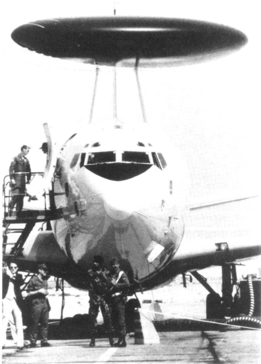
Dans les années qui viennent, la Suisse sera-t-elle amenée à participer à un réseau d'alerte au niveau du continent. Ici un AWACS.

permettre d'atteindre nos objectifs en matière de politique de sécurité, garde le nom de Défense générale . A notre avis, ce terme est trop restrictif; on aurait pu montrer, en choisissant une désignation nouvelle, qu'il ne s'agit pas seulement de l'ensemble des mesures en vue de la défense et de leur organisation, mais aussi d'une politique active et