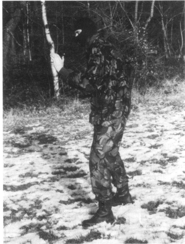
... et de profil.