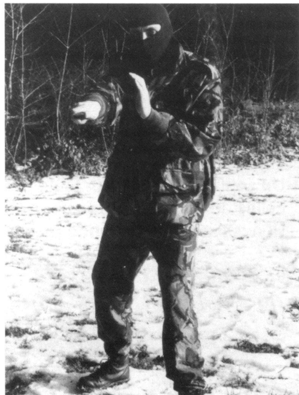
Le coup de pointe.

Si l'on veut obtenir des résultats probants, le «close-combat» doit faire l'objet