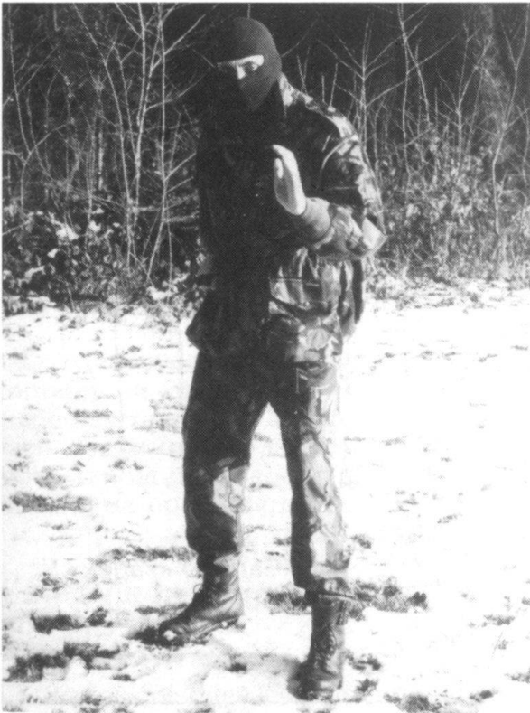
La garde... de face

La garde est la position de départ. La baïonnette est dans la main forte (main droite pour un droitier, gauche pour un gaucher). La main faible est en protection à la hauteur des yeux. Les genoux sont légèrement fléchis, le centre de gravité est bas.