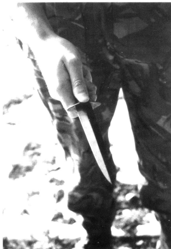
Tenue d'un couteau à double tranchant.