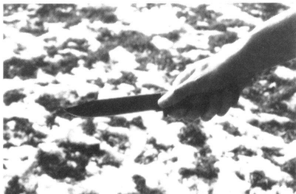
Tenue d'un couteau à tranchant unique.

La prise en main est le facteur essentiel qui permet le contrôle optimum de l'arme. La lame d'un couteau à double tranchant, telle celle de la baïonnette du fusil d'assaut 57 , sera tenue à plat. Le couteau de combat, qui accompagne le fusil d'assaut 90 , sera tenu le tranchant vers le bas. N'oubliez pas le camouflage de la lame : il suffit de la frotter avec de la boue.