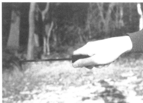
La même arme, pour la frappe dans le torse.