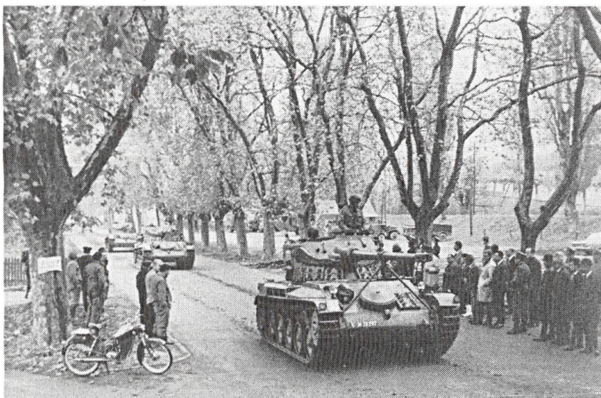
Le char 68 doit remplacer l'AMX-13.

système d'armes, il fallait considérer plutôt 12 que 8 ans. Le court terme enfin était dicté par la préparation d'un projet à présenter au Conseil fédéral et, par lui, à la procédure parlementaire.