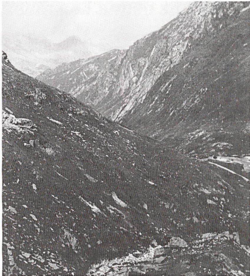
...qu'elle soit appelée à se battre en plaine ou en montagne.

En 1975, le chef de l'état-major général présentait pour la première fois un cadre référentiel pour le développement de l'armée, appelé Plan directeur armée 80 . Ce plan basait – fait nouveau – sur un concept global de défense la «politique de sécurité» du Conseil fédéral, dont les Chambres fédérales avaient pris connaissance. Ainsi, le premier plan directeur jouissait d'une bonne légitimation. A