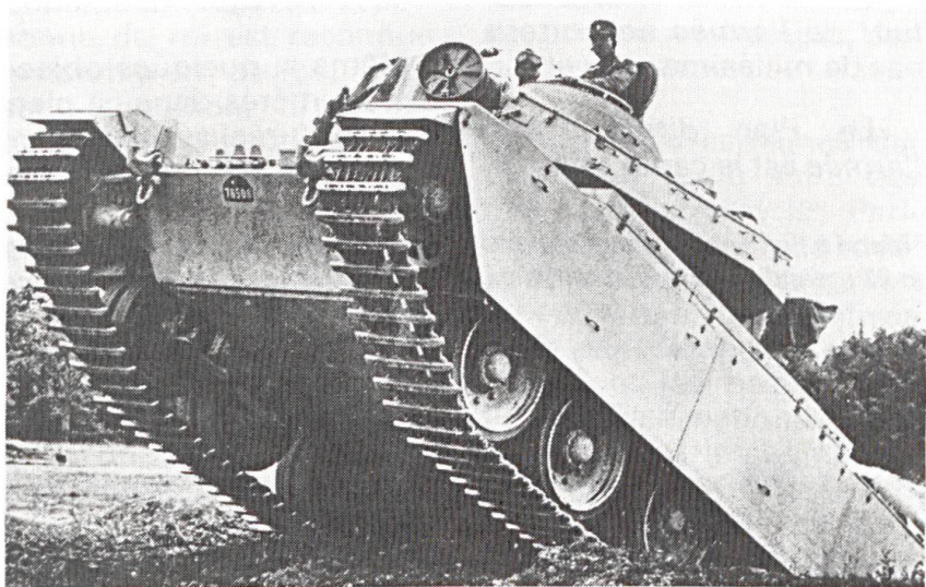
Lorsque l'on parle de « Rolex » à l'état-major général, ce sont encore les Centurions qui constituent le fer de lance de nos divisions mécanisées.

teinte dans le court terme. Le moyen terme était défini comme la durée d'une législature du Parlement, donc 4 ans. Le long terme couvrait plusieurs législatures, donc 8 à 12 ans. Compte tenu du temps nécessaire pour développer, évaluer et rendre « mûr » un