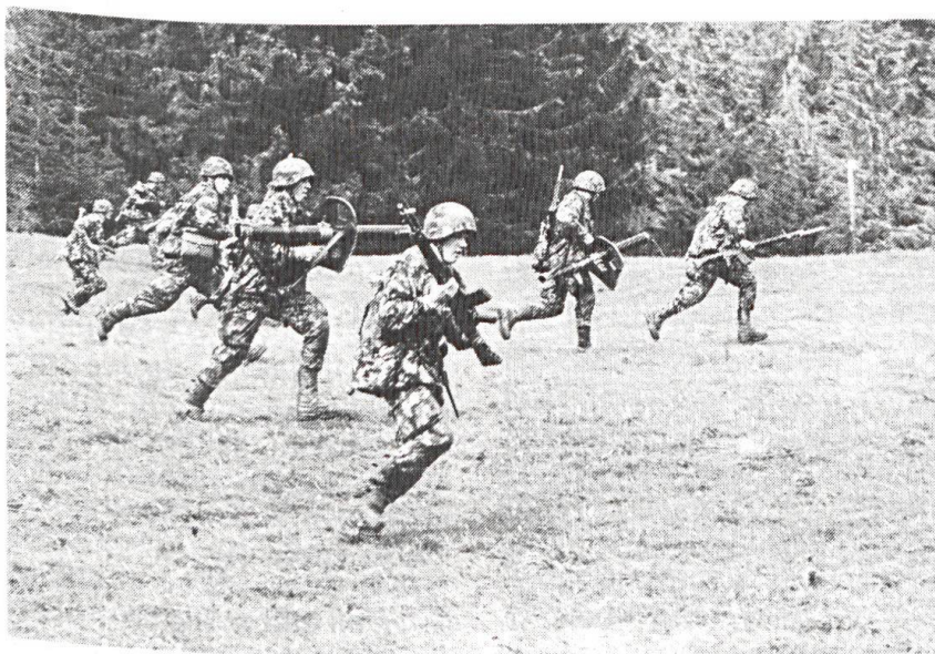
L'infanterie a conditionné longtemps la doctrine militaire de notre pays...

Ainsi, l'étude «Rolex» débouchait sur la question de la durée de notre défense. Partant de notre doctrine de «défense combinée» prévoyant une combinaison d'actions défensives et offensives, les dernières étant constituées de ripostes mécanisées appuyées par l'aviation, on arrive à chiffrer sommairement le nombre de ripostes possibles dans un cas opératif donné. «Le combat cessa, faute de combattants», lit-on dans Le Cid . En Suisse, le combat organisé de l'armée cesserait au moment de l'épuisement des moyens de riposte. L'étude «Rolex» de 1968 chiffrait cette durée à 8 jours environ. Ce chiffre ne pouvait être, ni faux ni juste. Mais il fallait le considérer comme une indication de base pour la planification.