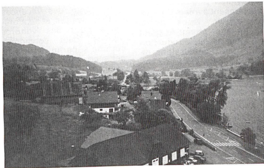
A droite, le lac d'Aegeri et la route en direction du défilé du Morgarten (à l'horizon).

Un tout autre problème est de savoir si cette armée 95 est réalisable, compte