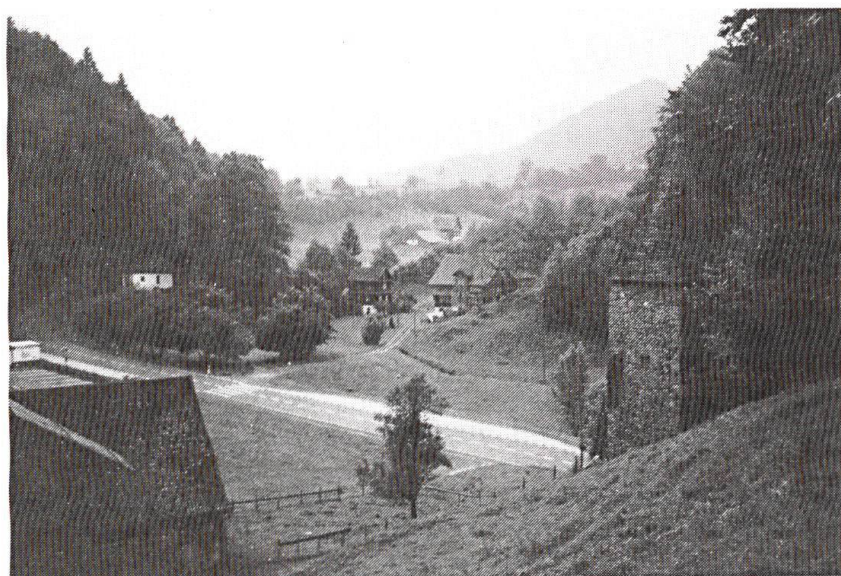
Le défilé du Morgarten. Au premier plan à droite, une partie du «Letzi». A gauche à l'arrière-plan, la chapelle.

Pourtant, en raison de nos difficultés économiques, politiques, sociales, il importe de nous souvenir de nos racines. C'est la raison essentielle justifiant notre présence à Morgarten. Nous devons reprendre des forces, retrouver notre vigueur.