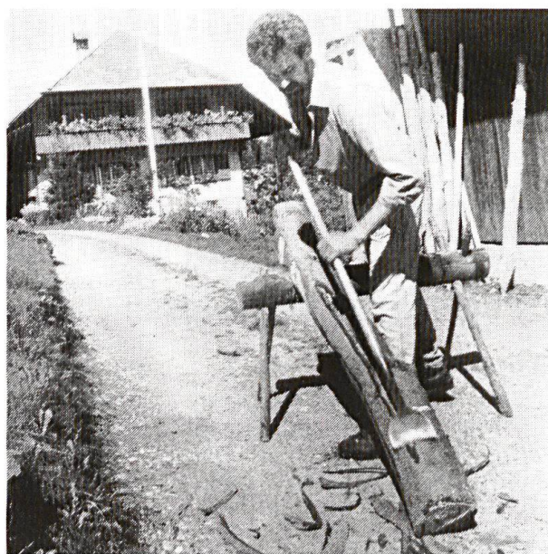
Die Arbeit müssen soweit als möglich überwacht werden.