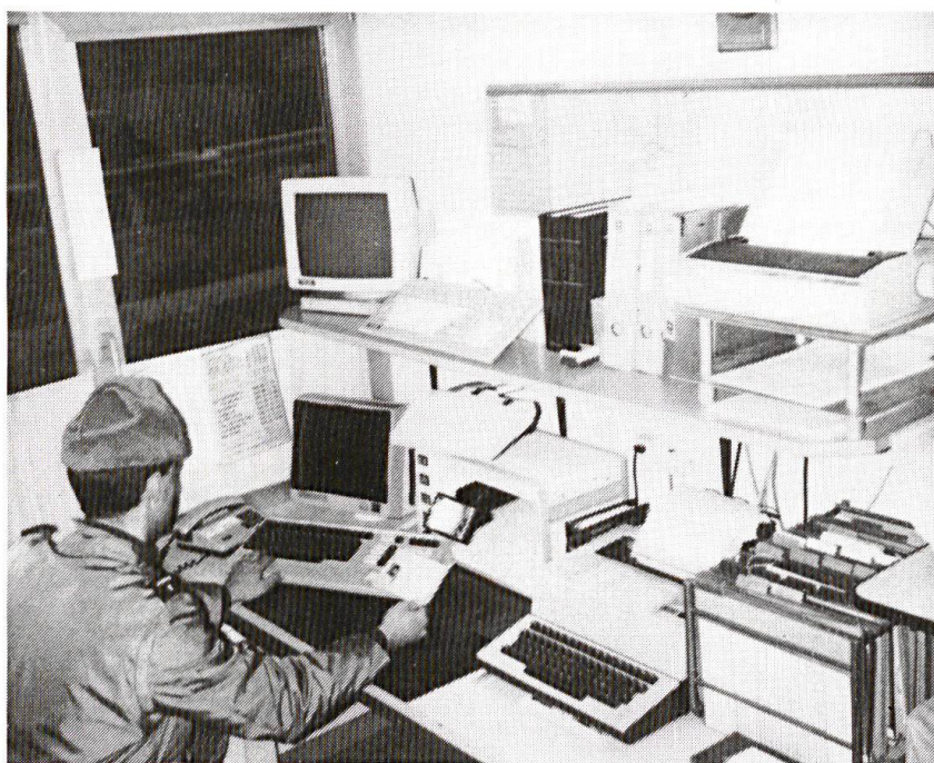
Un matériel d'informatique et de transmissions très performant permet aux gardes-frontière d'effectuer des contrôles efficaces jusque dans la profondeur du secteur.

1. Le régiment de forteresse 1, regroupant les moyens de feu des anciennes brigades (lance-mines de 12 cm), les ouvrages minés et les barrages qui subsisteront. Les gardes-fortifications et les mineurs des brigades seront transférés dans ce régiment. Comme les gardes-frontière, les gardes-fortifications constituent un corps de professionnels de haut niveau. Ils contribuent de manière efficace à nos