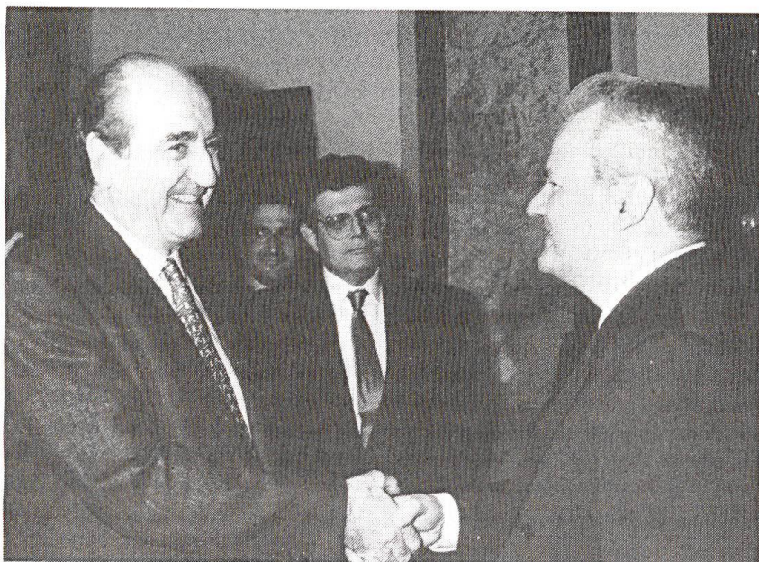
Belgrade, 6 avril 1993: Messieurs Mitsotakis et Milosevic se serrent la main avant leur entretien.

par le désir de s'assurer le soutien de ces gouvernements.