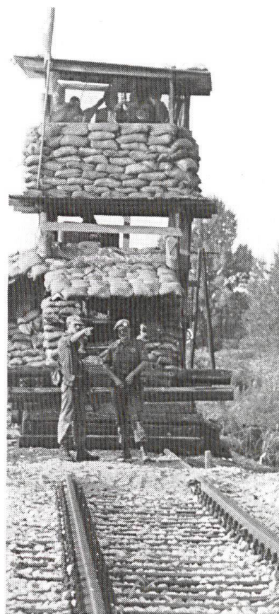
...Un travail de routine toujours dangereux: les contrôles.

Pour la majorité de la Commission, la Suisse doit tenir compte de l'évolution consécutive à la disparition de l'antagonisme entre deux blocs, à la plus grande instabilité outre-mer et en Europe, un facteur de multiplication des conflits locaux dont les populations civiles font généralement les frais. La politique de neutralité de la Suisse, qui doit être active comme le déclarait déjà Max Petitpierre en 1946, doit jouer un rôle à l'étranger. L'ins-