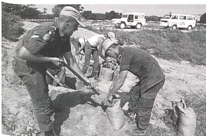
Dans le cadre d'une mission d'interposition en Bosnie, des Casques bleus belges préparent un poste de contrôle... (Photo Vox).

chaque citoyen sache de quoi il en retourne.