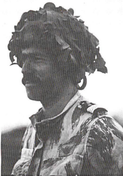
Un officier prépare sa prise de décision (Photo G. Rivet).

4 x 4 de construction nationale et d'origine française, le UMM , que l'on trouve dans toutes les unités de l'armée portugaise, le légendaire Mercedes U600L Unimog , immortalisé notamment par les guerres d'Afrique. Le transport lourd est encore assuré par des Mercedes mais de type 1013 A/36 .