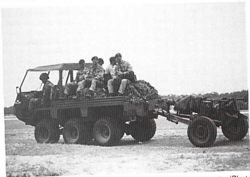
L'Esargo tracte un lance-mines de 12 et porte ses servants.

Cependant, la grande « révolution » au sein des paras est leur rattachement