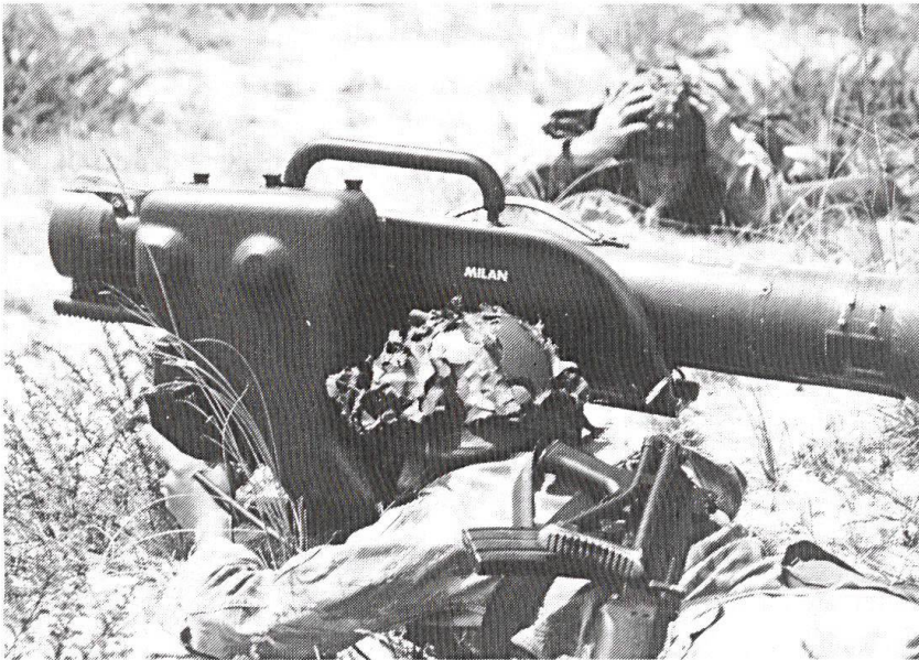
Poste de tir Milan.

à l'armée de terre, car depuis leur création, les bérets verts dépendaient des forces aériennes. Cette décision majeure, qui est loin de faire l'unanimité chez les officiers paras, devrait permettre la création d'une véritable force d'action rapide qui regroupera aussi les commandos et les forces spéciales de l'armée de terre et qui pourra ainsi rivaliser en hommes et en matériel avec ses alliés occidentaux.