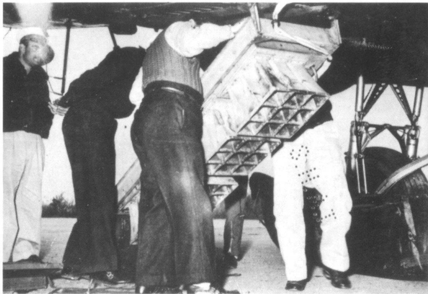
Vue sur les installations techniques de l'appareil.

Face à cette armée V.M., l'armée française en Indochine était la principale force vive. Elle aurait dû s'adapter. L'«Action» et en particulier l'«Action psychologique» étant avant tout œuvre d'imagination, les officiers et les sous-offi-