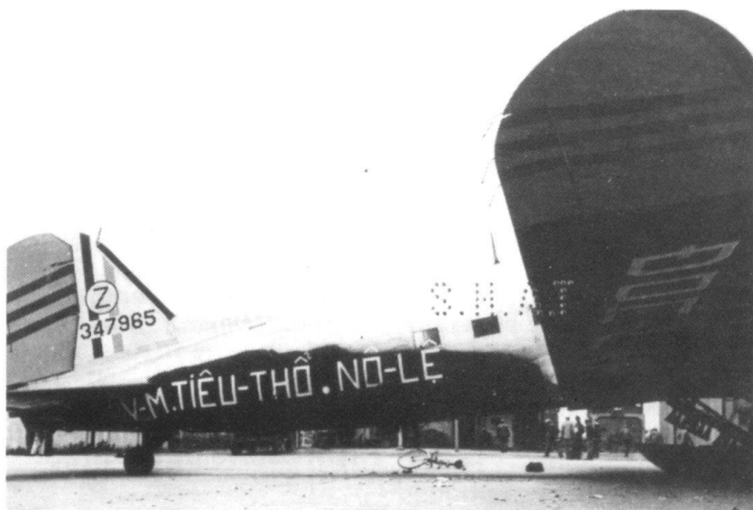
Le Dakota F-RBGZ/47: un slogan volant.

Bénéficiant des derniers renseignements obtenus au cours des essais effectués en Malaisie par la section des recherches opérationnelles (SRO) de l'armée britannique, l'équipage et l'officier chargé de l'action psychologique mettent au point, en accord avec le responsable de la propagande aux F.T.N.V. (Forces terrestres du Nord-Vietnam), la première mission qui commence le 4 décembre au matin. Ces renseignements, recueillis auprès des Britanniques, qui ont utilisé cet appareil, facilitent grandement l'organisation des missions et l'emploi de l'avion.