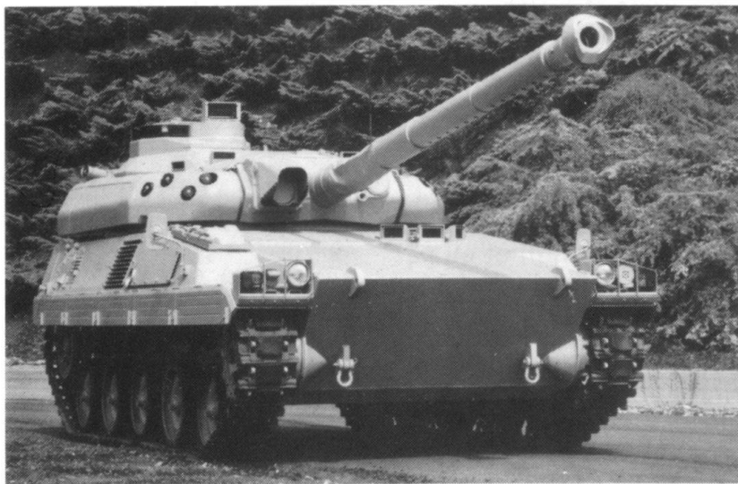
Le char Mars 15 C90.

Grâce à cette modularité, Creusot-Loire peut présenter, non seulement des engins complets issus de la production nationale, mais également un support motorisé susceptible de recevoir un montage local.