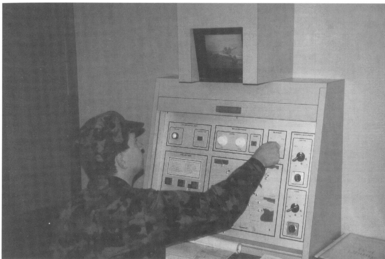
Poste de directeur d'exercice sur le simulateur d'exploration.