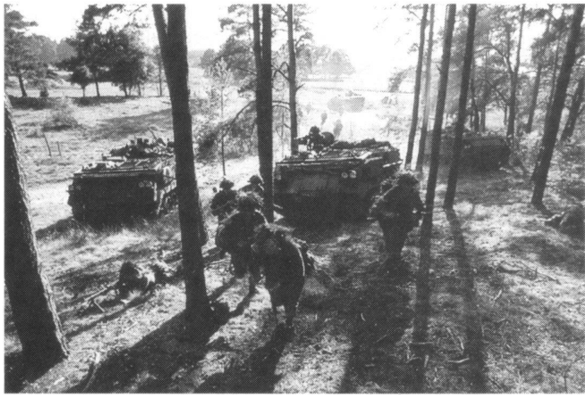
Infanterie mécanisée après le pied à terre.

L'OTAN a évolué pour faire face aux défis et aux risques de la nouvelle situation internationale, et le Royaume-Uni a bien accueilli cette nouvelle conception stratégique. On voit la création du Conseil de coopération de l'Atlantique Nord comme une contribution essentielle à l'établis-