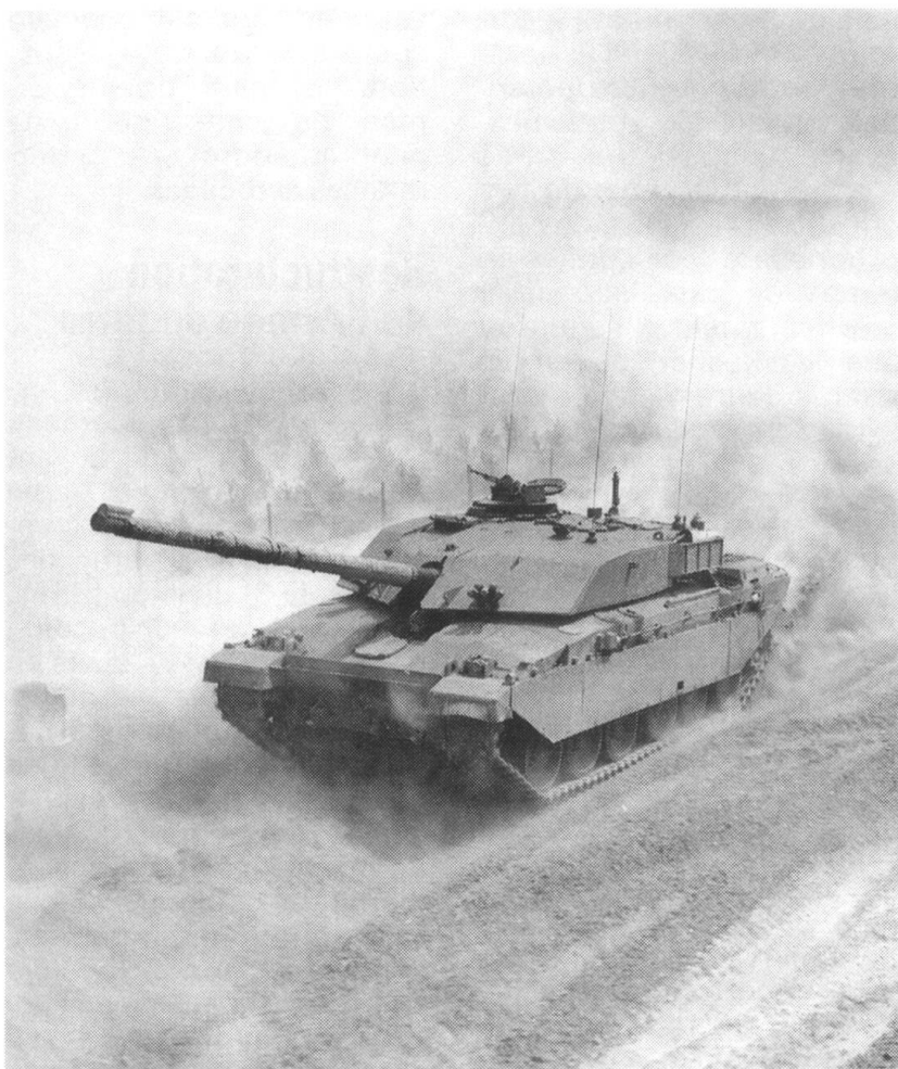
Char de combat Challenger.

étrangers, l'aide à l'instruction et à l'entraînement, les conseils y compris, s'avèrent un moyen appréciable d'aider des Etats amis à se constituer une défense propre. Actuellement, 370 militaires britanniques au total sont déployés dans des équipes d'instruction ou détachés dans 30 pays. Au Royaume-Uni, un nombre importants d'étrangers ou de ressortissants du Commonwealth sont instruits (en 1993, il y a eu 4200 stagiaires de 72 pays).