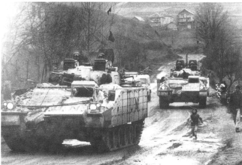
Véhicule de combat d'infanterie Warrior.

En Europe et en dehors d'Europe, l'assistance militaire à des gouvernements