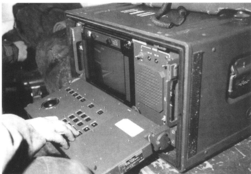
... Les mouvements ennemis apparaissent sur un écran.

avions suffiraient à assurer la couverture radar totale du territoire français et de ses approches.