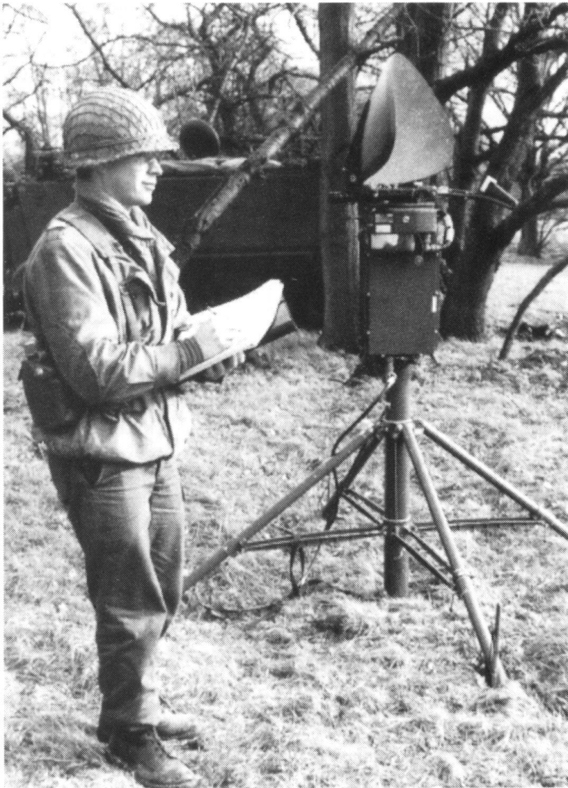
Radars de surveillance du champ de bataille EL/M2130A, réalisés en collaboration par la Belgique et Israël...

La portée des radars d'un avion AWACS est de 400 km à basse altitude. Ce système arrive à détecter et à suivre simultanément trois cents objectifs. Trois de ces