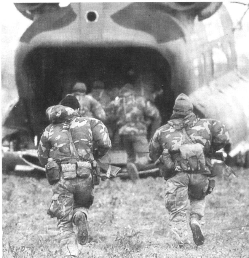
...et de forces de déploiement rapide qui disposent d'une flotte d'avions de transport capables d'emporter des gros tonnages.

tombes et de minimiser le coût, financier et humain, d'opérations militaires comme celles de la guerre de Corée.