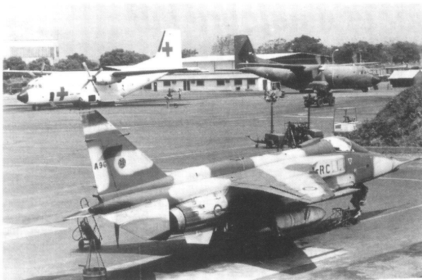
Une image symbolique de l'«ingérence humanitaire armée» (Photo tirée de Soldats de l'espoir. L'action humanitaire. Paris, Lavauzelle, 1993).

son magistral ouvrage Penser la Guerre , Clausewitz (1976). Le général italien Giulio Douhet (1869-1930) comprend la valeur révolutionnaire de l'arme aérienne, son traité, Il dominio dell'aria , publié en 1921 et largement diffusé dans les pays anglo-saxons a une influence considérable sur la conduite de la Seconde Guerre mondiale et des grands conflits de l'après-guerre. La guerre du Vietnam, puis la guerre du Golfe connaissent des bombardements aériens d'une intensité comparable à ceux pratiqués contre l'Allemagne et le Japon. Les idées de ces grands stratèges occidentaux pénètrent la doctrine soviétique à la faveur des relations étroites qui existent au temps des tsars (Jomini et Clausewitz servent dans l'armée de la Russie impériale) puis, surtout, entre l'armée allemande et l'armée rouge dans l'entre-deux-guerres.