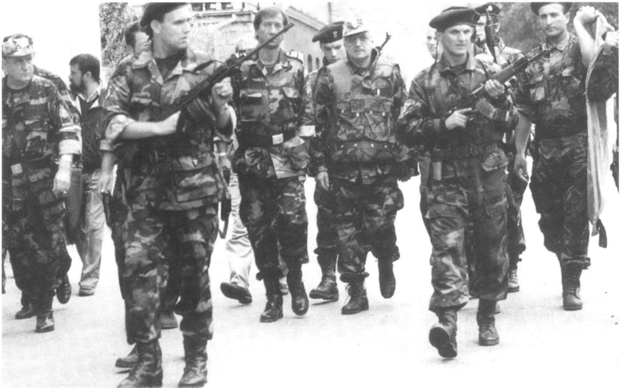
La fin de la guerre froide et la disparition de l'Union soviétique n'ont pas amené la paix mais la resurgence de conflits régionaux ethniques ou religieux. Ici le président croate Franjo Tuđman inspectant ses troupes.

manière à éviter leur détournement par des factions armées. Ponctuellement des sanctions coercitives sont parallèlement engagées 5 .