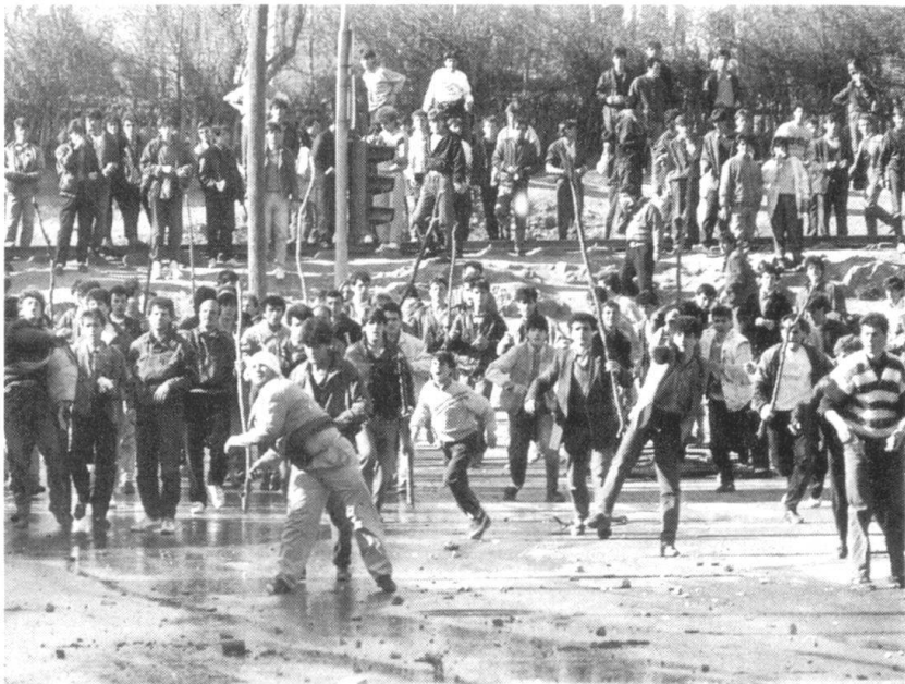
Affrontements au Kosovo.

Très difficile de dire comment ces problèmes ardues pourraient déboucher sur des solutions pacifiques, ce qui signifie en clair que la «Troisième Guerre des