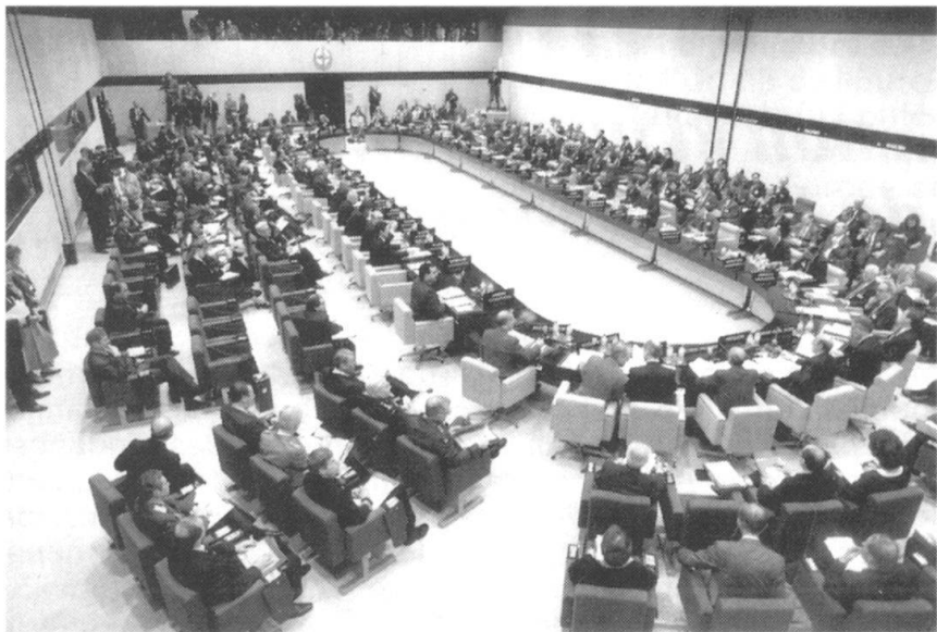
Des pays comme l'Albanie et la Bulgarie souhaitent devenir États membres à part entière de l'Union européenne et de l'OTAN. Ici une séance du Conseil de coopération nord-atlantique en mars 1992.

En résumé, la Bulgarie se trouve coincée entre le marteau et l'enclume. Elle ne