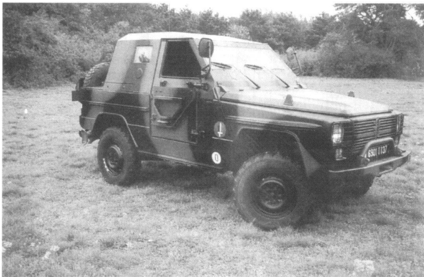
Panhard a développé un «Kit» de protection pour le Véhicule léger tout terrain P4 4 x 4.

les autres. A ce soldat, il ne faut pas laisser le temps de trop penser, il faut l'occuper en permanence à des activités qu'il maîtrise parfaitement. Un plus pourrait être apporté dans l'accoutumance des hommes, en particulier des cadres, à l'horreur: un homme blessé qui souffre, un enfant déchiqueté peuvent, au mauvais moment, faire perdre ses moyens à un homme et, partant, mettre sa vie en danger. Un stage de quelques jours en SAMU pendant la formation à Coëtquidan ou à Saint-Maixent ne serait pas inutile.