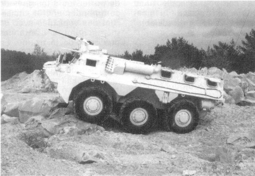
Véhicule de l'avant blindé (VABNG).

Cependant, la semaine précédant le 17 juin a été particulièrement bénéfique pour la préparation au combat du groupement, ce qui lui a permis d'affronter l'épreuve du feu dans les meilleures conditions de cohésion. Les missions remplies du 9 au 16 juin avaient déjà appris aux sections à travailler ensemble, puisque l'on a «binômé» une section VAB et une section VLRA.