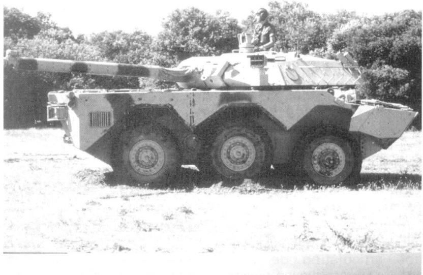
AMX 10 RC..

Le gilet pare-balles est essentiel pour la psychologie et pour la protection. Son ergonomie devrait être revue, car on cale difficile-