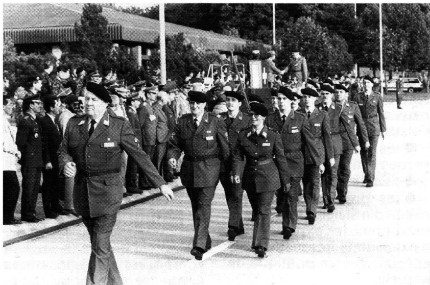
Une délégation suisse qui a bonne tenue.

En plus des cinq pays fondateurs, la France, la Belgique, le Danemark, le Luxembourg et les Pays-Bas, cent un Etats ont adhéré à ce Conseil dont les buts sont de favoriser l'expansion du sport militaire, de développer des relations amicales entre les forces armées des Etats membres, de dispenser une assistance technique sportive, de contribuer à l'épanouissement équilibré et harmonieux de la jeunesse et enfin de contribuer à l'effort mondial en faveur de la paix. Sur les cinq continents, vingt-quatre discipli-