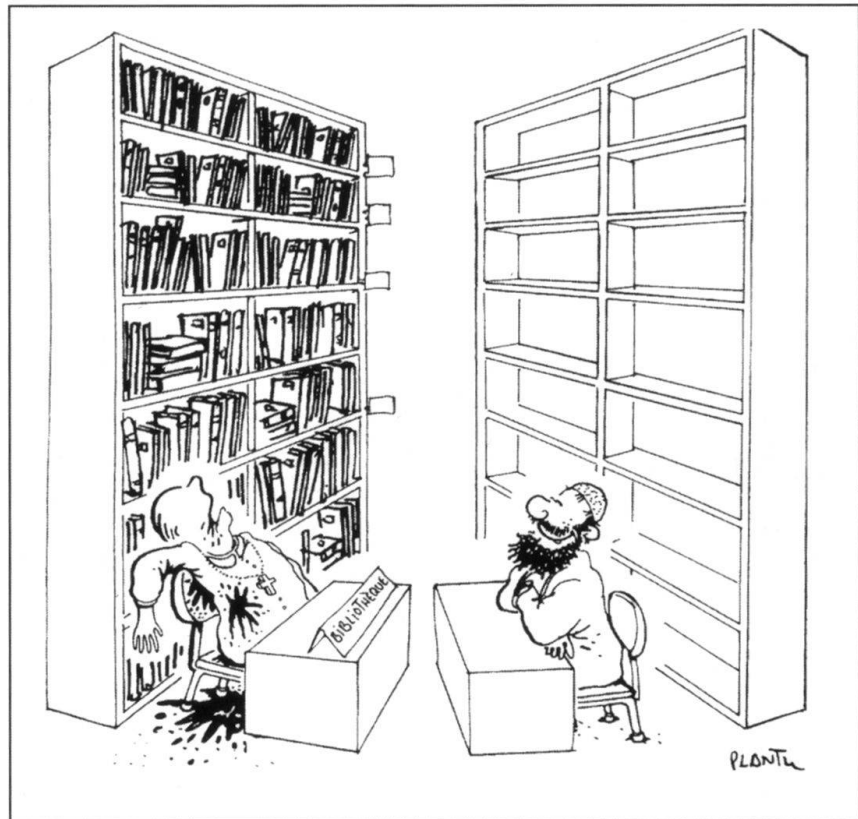
Dans l'après-guerre froide, des spécialistes, des analystes doivent apprécier des données immatérielles comme la montée de l'intégrisme en Algérie... (Dessin de Plantu dans Le Monde du 10 mai 1994).

Le nombre des protagonistes, qu'ils relèvent ou non d'un Etat, croît sans cesse (cartels de la drogue, mafia, etc.), de même que les moyens utilisés par ceux-ci: la faim utilisée comme une arme par des clans en Somalie, la conquête de territoires par le nettoyage ethnique en Bosnie. Compte tenu du nombre rapidement croissant des foyers d'instabilités et de risques, de leur interdépendance, de leur évolution fulgurante et de leur dynamique spécifique, la prévisibilité est devenue plus aléatoire et l'incertitude augmente de manière angoissante. Il est vrai que, dans le domaine classique de la