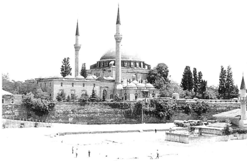
... ou dans la Turquie « laïque. Ici la mosquée de Selim à Istanbul.

Dans l'amalgame « politique de sécurité – politique intérieure et extérieure », l'appréciation de la situation politico-stratégique devient un instrument important d'ouverture et de dialogue. Elle prend une valeur de « pont » entre les organes décisionnels initiés et le grand public. A cela s'ajoute le fait que le public a acquis une compréhension exacerbée de la « vulnérabilité » dans les relations entre Etats. Ce sera donc également le rôle de l'appréciation de la situation politico-stratégique de révéler les nombreuses formes de vulnérabilité. La politique de sécurité acquiert une fonction de prévoyance, elle a un devoir qui va