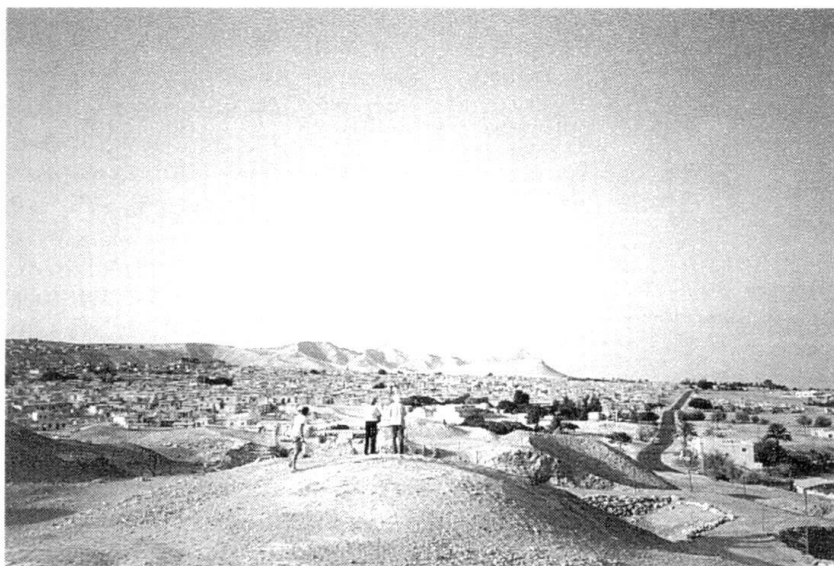
...la montée ou la baisse de la violence et du fanatisme dans la région de Jéricho...