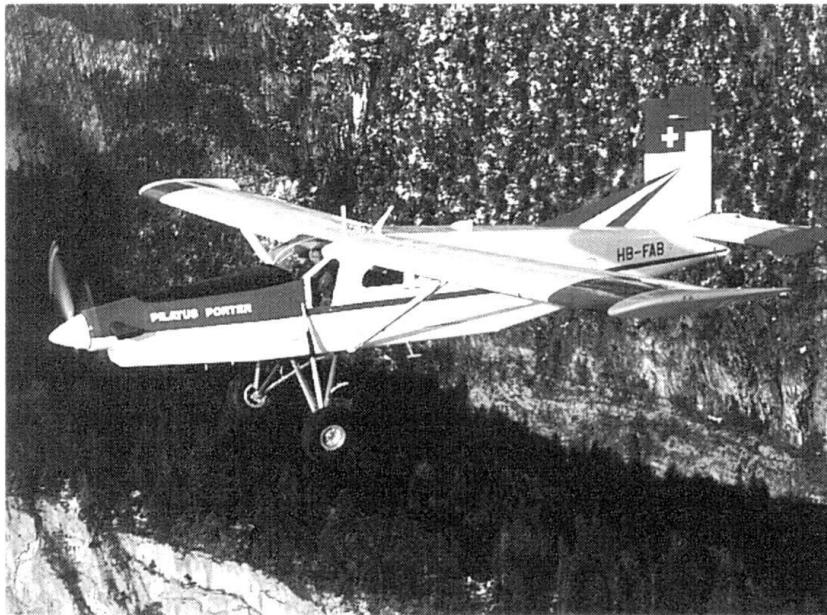
PC-6/B2-H4 le dernier né de la famille Pilatus Porter.

naissants sur une surface atteignant 20 m de large et 60 à 120 m de long.