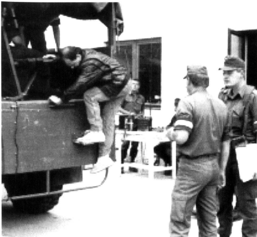
Si nécessaire, la Bundesheer recueille et s'occupe de réfugiés, un problème que l'autorité civile ne peut plus gérer vu l'afflux.

Si la menace s'aggrave à la frontière ou si l'opération s'étend dans la durée, on engage des forces rapidement disponibles supplémentaires. La procédure de décision est accélérée. Au besoin, ces forces sont prises dans les formations opératives qui sont limitées à un maximum de 5000 hommes. Pour accélérer la constitution de ces forces, des formations précises sont maintenues temporairement avec le statut de formations de couverture frontière de milice. Elles sont en tout temps rapide-