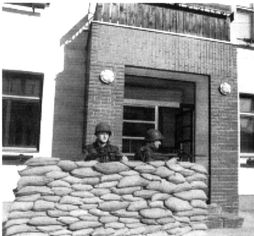
Lors d'un service d'appui aux autorités civiles, la Bundesheer prend en charge des missions de garde d'objets sensibles.

L'engagement de forces rapidement disponibles et,