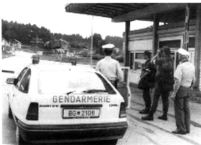
Comme l'armée suisse, la Bundesheer peut être appelée à renforcer les gardes-frontière...

Dans la défense combinée, il s'avère parfois nécessaire de subordonner à un commandant militaire plusieurs groupements de la force d'un bataillon, de lui assigner des missions de conduite tactique, comme la flanc-garde du dispositif, le combat contre des troupes aéroportées ou des missions en relation avec la protection territoriale.