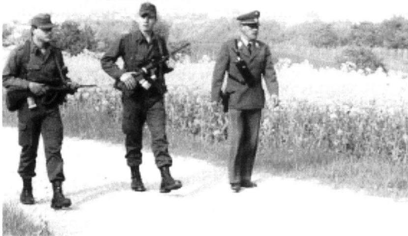
... Des soldats patrouillent avec les garde-frontière.

Les forces de présence sont principalement constituées par des relèves de corps de troupes, complets ou partiellement mis sur pied dans leurs structures du temps de paix, qui sont organisés en fonction de la situation et de missions précises (missions de présence), conformément à la composition et à l'ordre de bataille spécifiques à chaque arme.