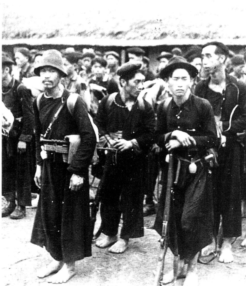
Laos, Khang Khai, 30 avril 1954. Les partisans Méos prêts pour l'OPS «D» au profit de Dien Bien Phu.

tionnés parce qu'ils aiment le travail en solitaire, qu'ils savent survivre avec ce dont ils disposent sur place et prendre des initiatives. Ce sont des hommes qui n'accordent d'importance qu'à ce qui peut leur être utile dans le cadre de la guérilla. Il ne faut pas faire trop de distinctions entre «spéciaux» et militaires.