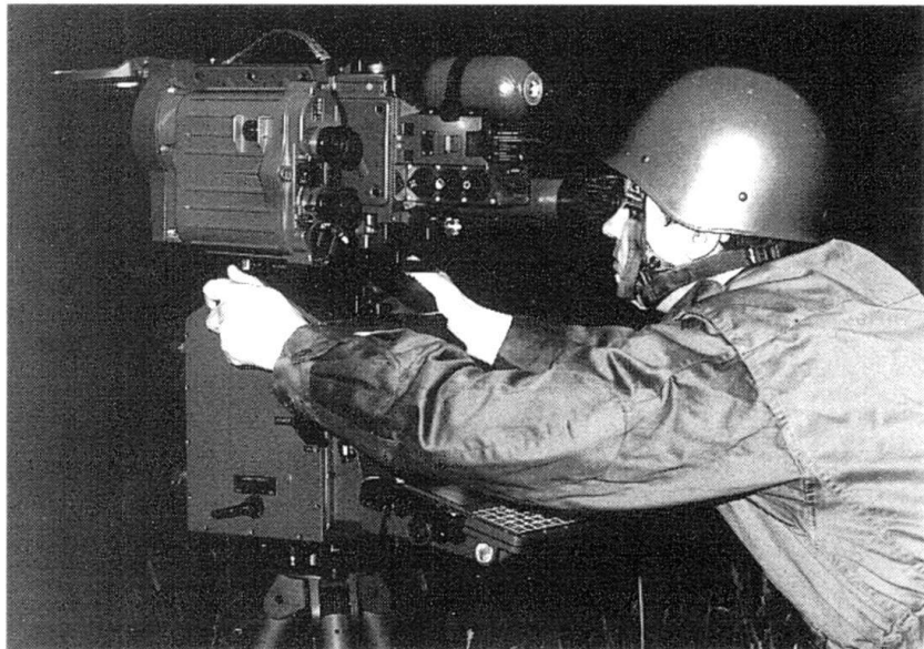
Télépointeur d'artillerie infrarouge portable (Photo Thomson-TRT).

Cela représente donc 9 groupes à 18 pièces cha-