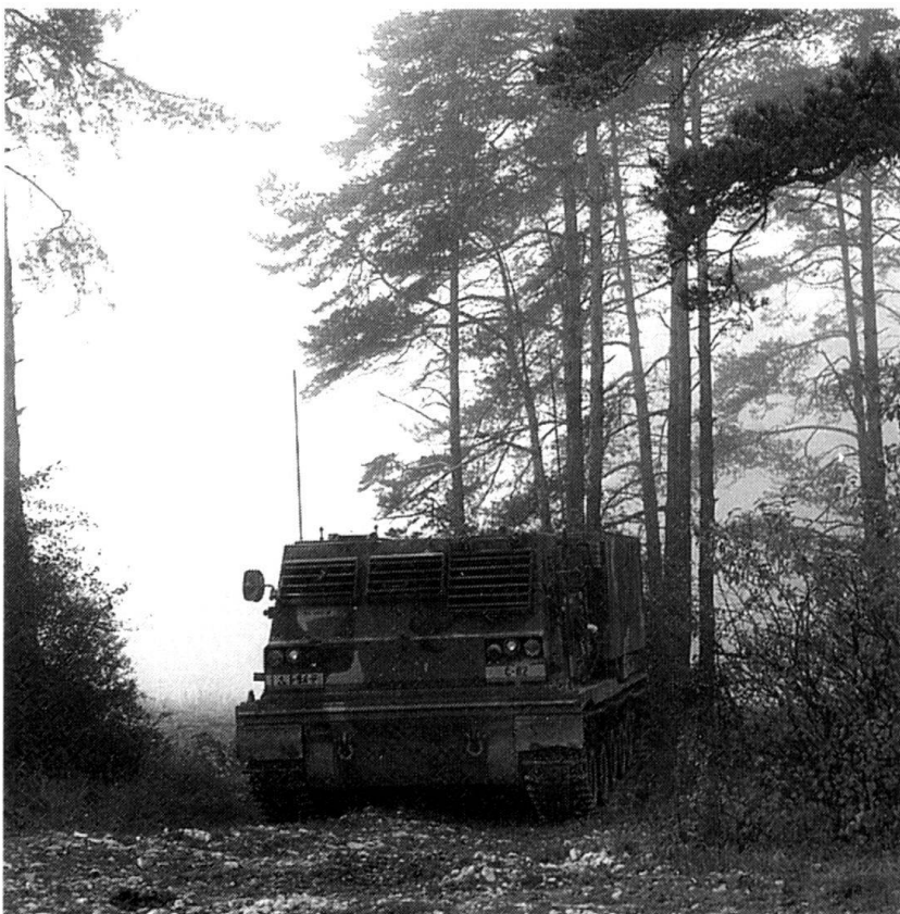
Un LMRS en position.

Avec nos excuses, nous rétablissons le texte: «C'est seulement vers l'an 2000 que l'on songe [en Suisse] à l'acquisition d'une artillerie opérative (...). Le LMRS ferait l'affaire, la comparaison parle d'elle-même: en une minute, un groupe d'obusiers blindés (18 pièces) tire 90 coups avec une efficacité au but de 5670 bombets. Une section LMRS (4 pièces) tire 48 coups avec une efficacité au but de 30193 bombets.» (Réd.)