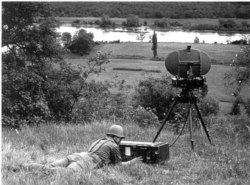
Radars de surveillance du sol et d'aide à l'artillerie (Photo Thomson-CSF).

- l'échelon tactique supérieur, afin de créer des conditions favorables pour ses propres groupements de combat. Ces objectifs sont battus par l'artillerie du corps d'armée et des divi-