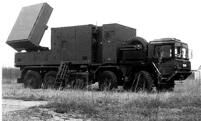
COBRA: Counter Battery Radar/radar de contre-batterie, champ de bataille à état solide et antenne active.

Avec l'équipement d'un ATACMS, le LMRS tire jus-