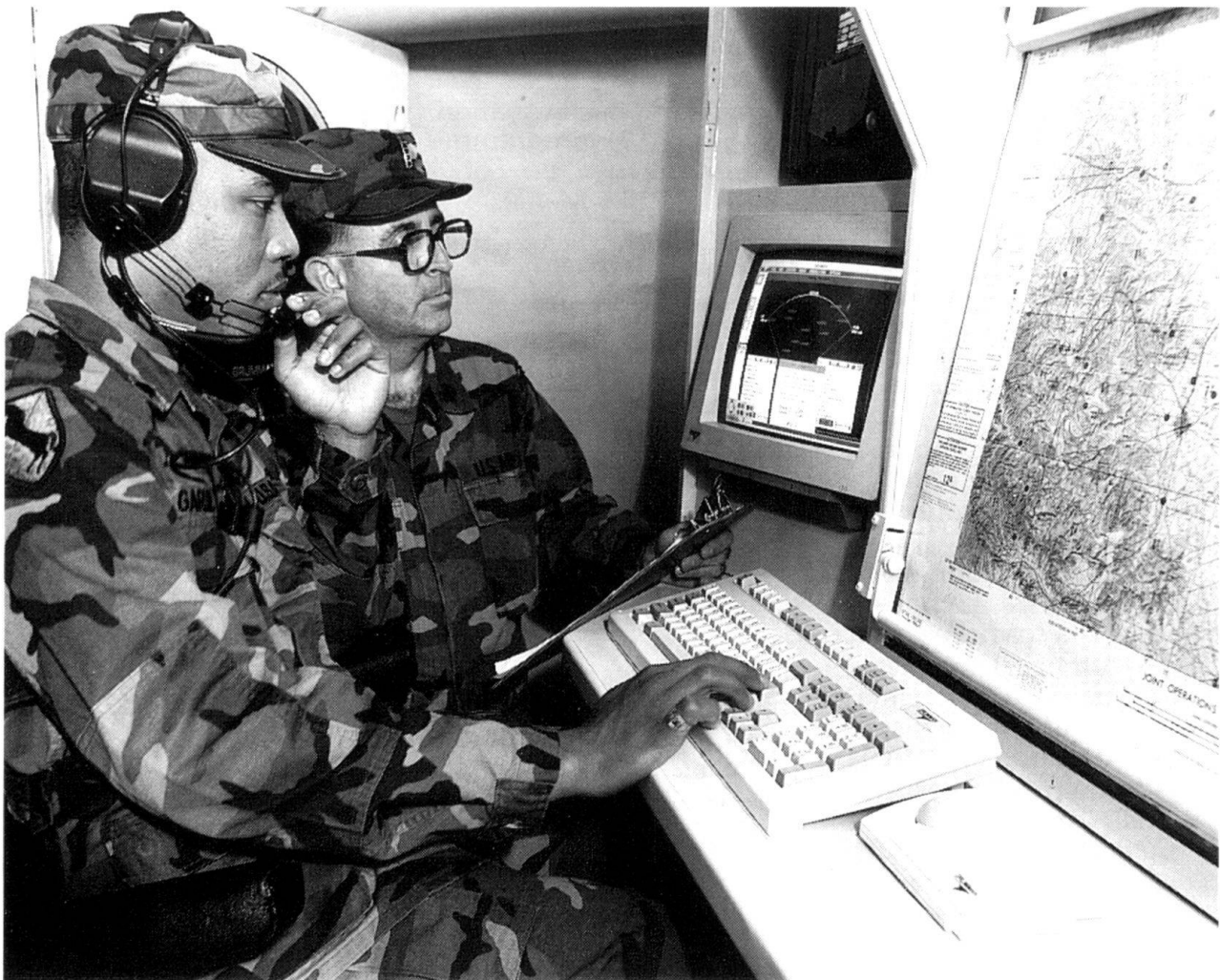
Système radar de contre-batterie Northrop Grumman (Photo Northrop Grumman Corporation).

qu'à 150 km et devient ainsi l'arme au niveau armée et corps d'armée.