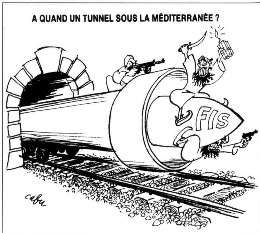
Libre Journal, N° 23-24.

Sur quoi pourrait déboucher la situation actuelle? Première hypothèse, les éléments les plus radicaux de l'armée réussissent un coup d'Etat. Deuxième hypothèse, un régime rigoriste s'installe, résultant d'un compromis entre des militaires et des islamistes influencés par l'Arabie saoudite. Les Européens se la-