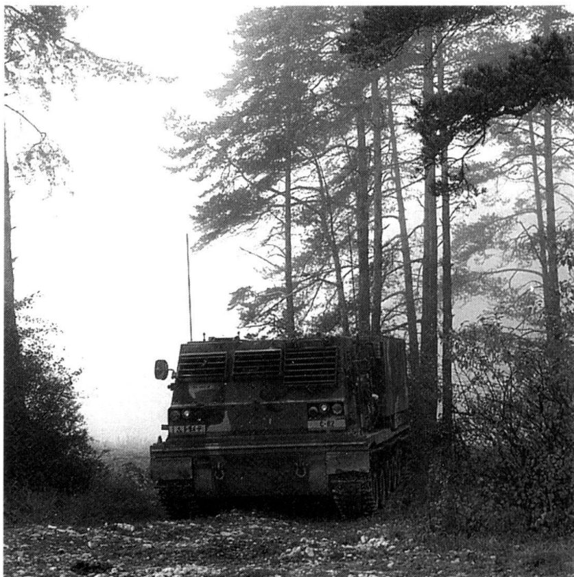
Un LMRS en position.

Avec nos excuses, nous rétablissons le texte: «C'est seulement vers l'an 2000 que l'on songe [en Suisse] à l'acquisition d'une artillerie opérative (...). Le LMRS ferait l'affaire, la comparaison parle d'elle-même: en une minute, un groupe d'obusiers blindés (18 pièces) tire 90 coups avec une efficacité au but de 5670 bombles. Une section LMRS (4 pièces) tire 48 coups avec une efficacité au but de 30193 bombles.» (Réd.)