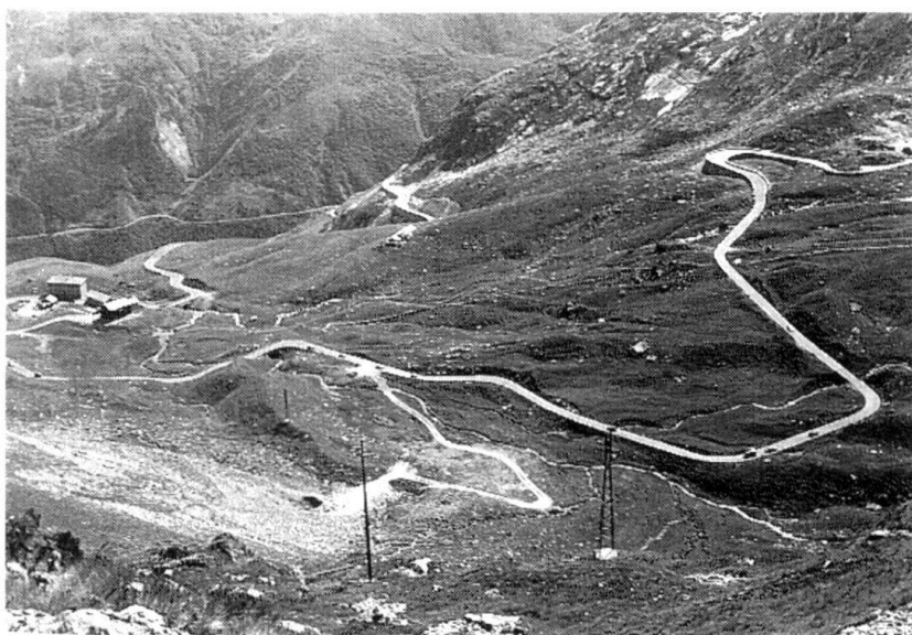
A part le Simplon, les troupes romandes sont aussi concernées par le Grand Saint-Bernard.

Avec l'armée 95 et la notion de défense dynamique du territoire, les brigades frontière et de réduit ont été supprimées. Ce choix n'implique en aucune façon un affaiblissement de notre frontière Sud, partant de la transversale alpine du Simplon, bien au contraire. La grande différence réside dans la possibilité désormais offerte de marquer davantage des efforts principaux en telle ou telle partie du territoire, sans être forcément fixé ou lié à un secteur ou à un terrain. Pour faire face à une menace Sud dans un cas de défense, des troupes dites librement disponibles pourraient être amenées à remplir dans le secteur du Simplon des missions de barrage ou de protection; elles seraient probablement plus