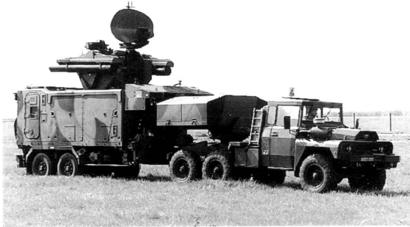
Le Roland 3 – Un système d'arme qui a fait ses preuves maintenant aérotransportable (Photo Euromissile).

A l'image des avions de chasse modernes, le système Roland est mobile et autonome pour mener sa mission. Il réalise la totalité des opérations depuis la détection jusqu'à la destruction de la cible. Dans sa mission d'accompagnement des forces mécanisées, le système, qui occupe les points hauts du terrain, n'a pas réellement besoin d'être tout terrain, mais seulement «tout chemin». Il n'évolue jamais aux côtés des blindées, mais il les protège en s'éloignant et en s'élevant. Engager plusieurs pièces d'une manière coordonnée permet de protéger un secteur de plusieurs centaines de kilomètres carré, ce qui réduit d'autant les nécessités de déplacements.