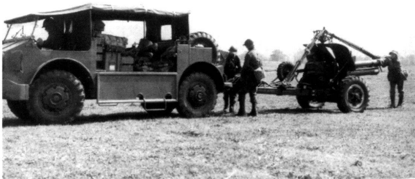
C'est avec l'Armée 62 que l'artillerie tractée cède progressivement sa place aux obusiers blindés, du moins dans les formations de plaine.

Car chacun sait que l'instruction est affaire des