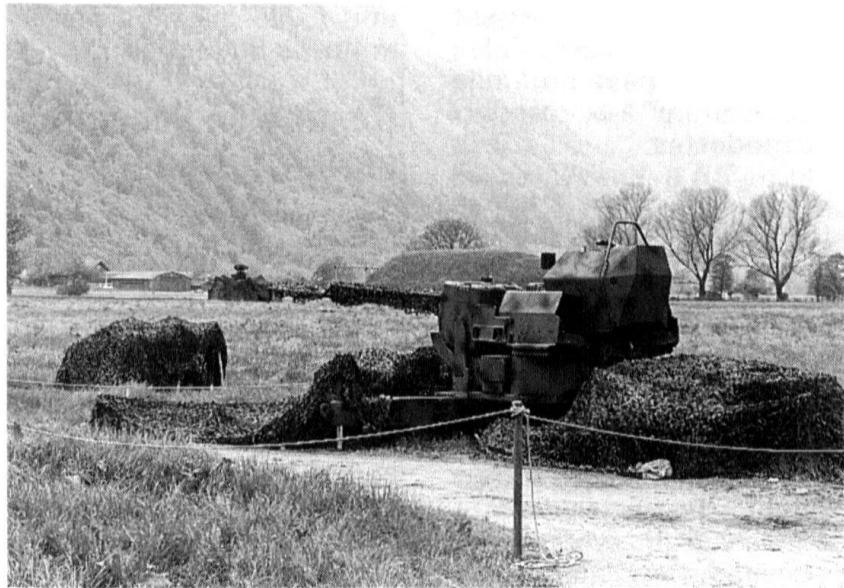
Le canon DCA 35 mm 63/90, en position.

Dans une telle situation, la mission de nos troupes d'aviation et de défense contre avions est essentiellement politique. Elle implique une disponibilité opérationnelle permanente ainsi qu'une certaine autonomie d'action par rapport au reste de l'armée.