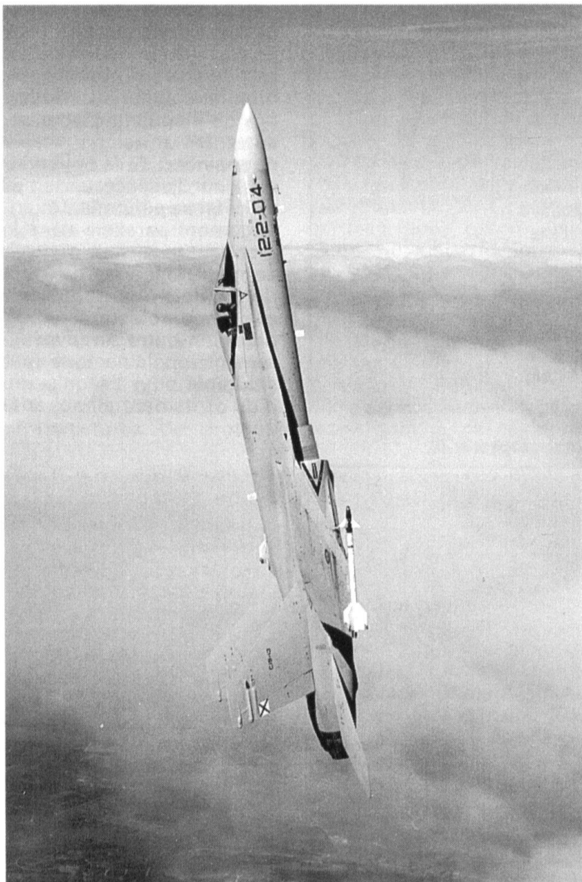
Le F/A-18 qui équipera les Forces aériennes suisses (Photo Caption).

Force est de constater qu'aux temps difficiles qui ont précédé la votation du 6 juin 1993, où notre aviation militaire jouait sa survie, succèdent des temps encore plus difficiles ! Les réformes de l'armée et du DMF, le rétrécissement drastique des budgets militaires nous obligent à renoncer à certaines missions, à diminuer nos effectifs, professionnels comme de milice, à réduire notre infrastructure, à sacrifier des systèmes et des unités. C'est un moment psychologique beaucoup plus délicat que lors du combat en rangs serrés