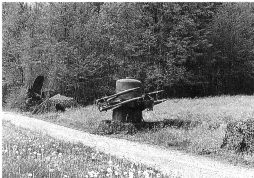
Une unité de feu Rapier, en lisière de forêt.

Même en cas d'hostilités dans notre espace aérien, la situation resterait complexe. En effet, l'identification positive des objectifs à combattre reste, mondialement, le problème le plus aigu de la guerre aérienne. Aussi longtemps que l'on doit traiter de façon différenciée diverses catégories d'aéronefs, en fonction de leur nationalité, du caractère de leur mission (humanitaire ou diplomatique, sans oublier les équipages égarés ou en fuite) et les distinguer de façon certaine de nos propres aéronefs, une identification visuelle sera nécessaire, avec tous les risques qu'elle comporte. Dans une telle situation, l'engagement sans restriction de missiles air-air et