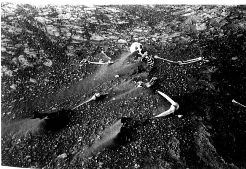
La grande erreur de notre temps: mélanger guerre et diplomatie, mission militaire et aide humanitaire...

C'est par des fournitures d'armes que souvent s'amorce le processus de rapprochement entre Etats : au début de ce siècle, l'alliance franco-russe, qui sort la France de son isolement diplomatique, est initiée par un important marché de