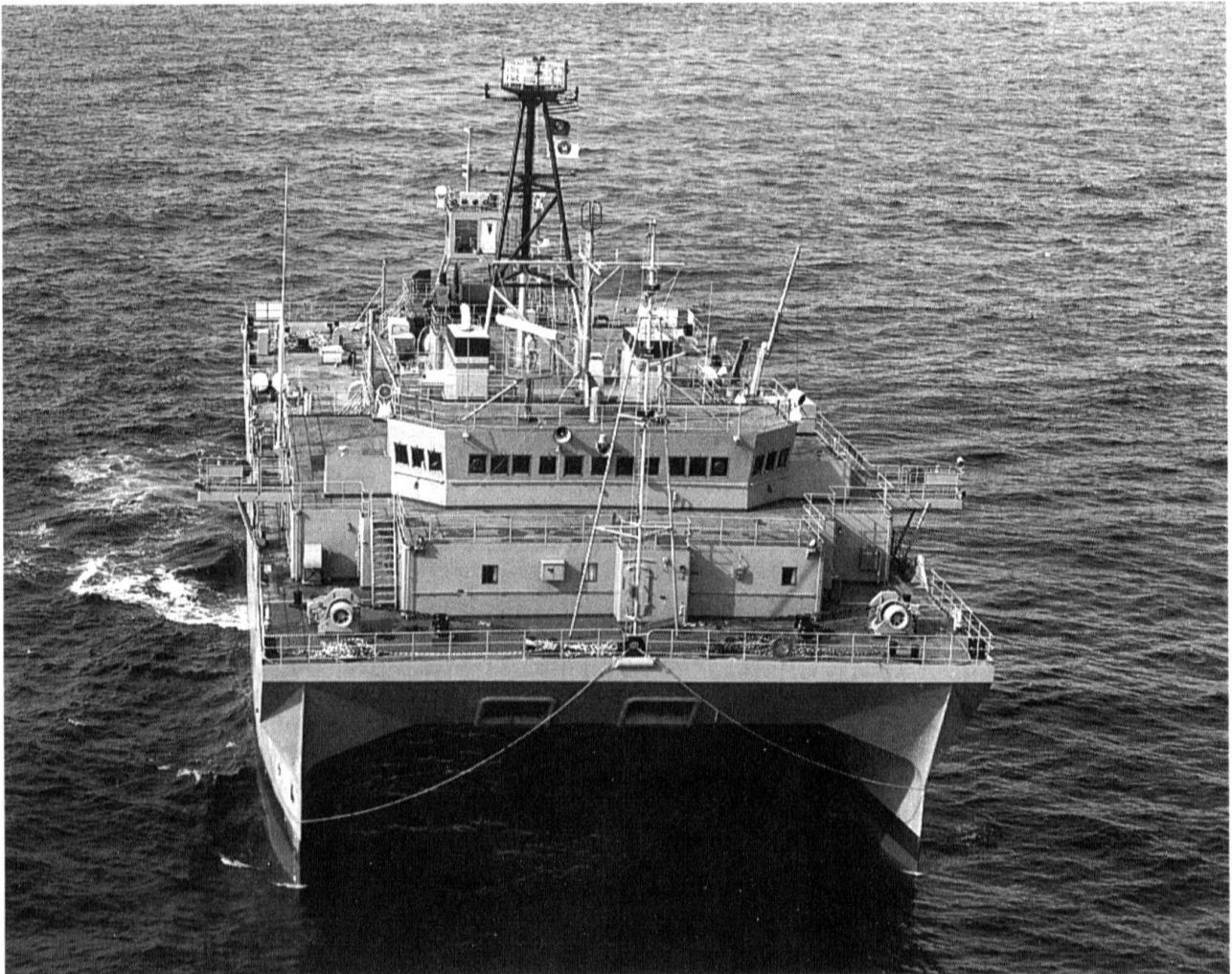
« La diplomatie navale est devenue la voie privilégiée de l'action extérieure ».

mais il revêt aujourd'hui une importance primordiale.