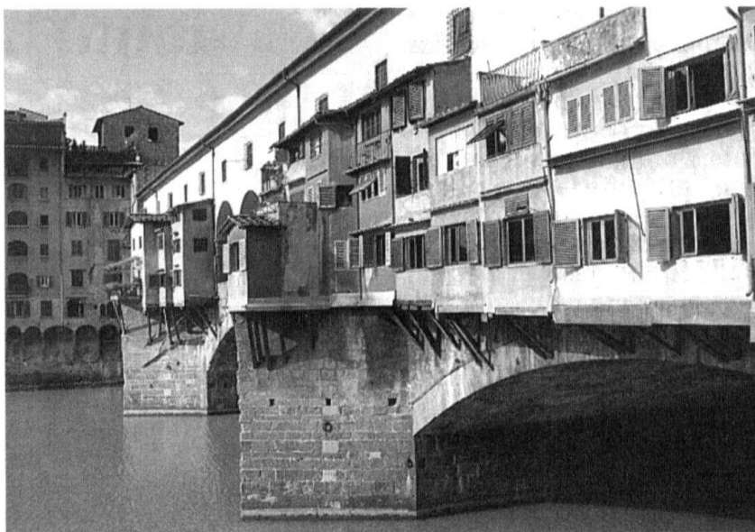
Ponte Vecchio 1994. A gauche du pont, les premiers immeubles de la nouvelle via dei Bardi reconstruits dans les années 1950.

Dimanche 30 juillet. Dès l'aube, l'évacuation des vieux quartiers historiques