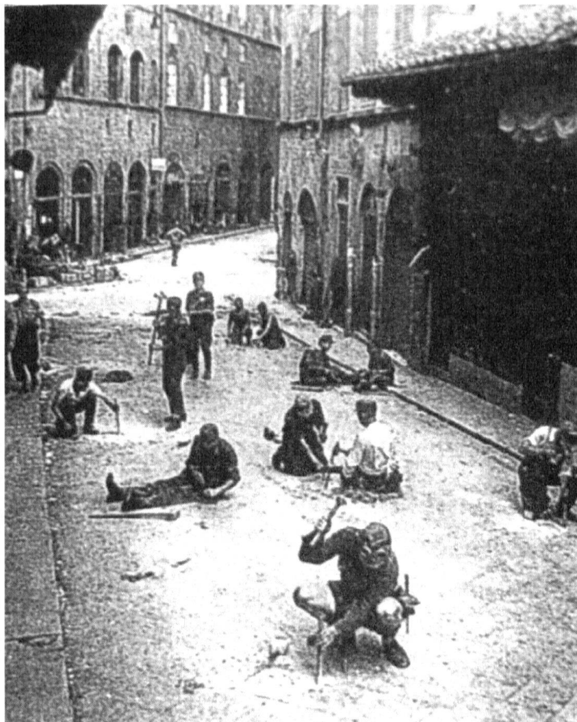
Lundi 31 juillet 1944. Les troupes allemandes placent des mines anti-personnel dans le tablier du Ponte Vecchio.

te » n'est pas morte et, telle l'Hydre à sept têtes, réapparaît depuis, sous bien des formes, de plus en plus fréquemment.