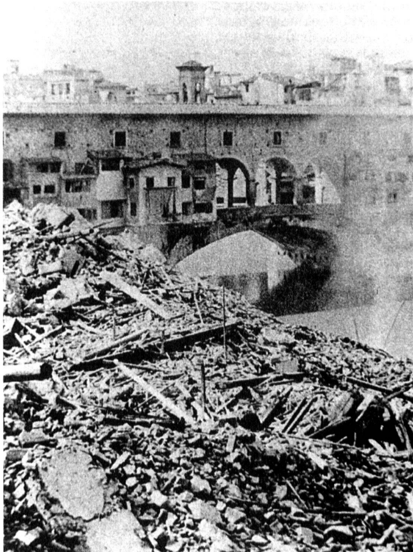
Ponte Vecchio 1944. Les gravats sont les ruines des immeubles de la via dei Bardi.

Le 13 octobre 1943, le nouveau gouvernement italien du maréchal Badoglio déclare la guerre à l'Allemagne. Mussolini, qui avait été arrêté en juillet sur ordre du roi Victor-Emmanuel III, est transféré de sa prison de l'île de la Maddalena à la station du Gran Sasso dans les Abruzzes, d'où il sera libéré par un commando SS commandé par le célèbre Skorzeny, le 12 septembre 1943. Après une rencontre à Munich avec Hitler, il revient en Italie du Nord pour y proclamer l'éphémère République sociale italienne de Salò.