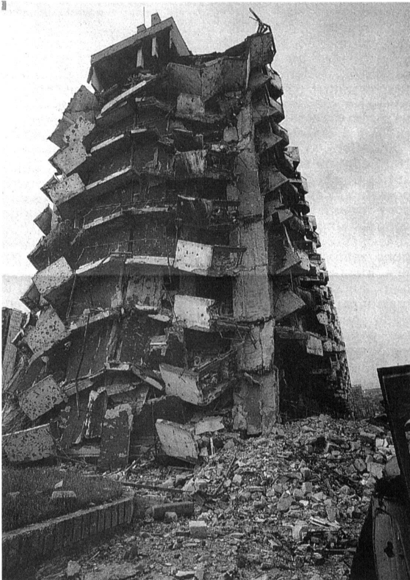
Quel est le rôle de la religion dans la guerre en Bosnie-Herzégovine ? L'état d'un immeuble à Sarajevo en juillet 1996.

Partis de l'histoire, nous débouchons ainsi sur l'ac-