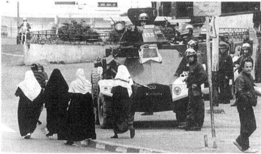
A Alger, l'armée est présente partout. Des blindés légers de la gendarmerie patrouillent en permanence dans les rues et 15 000 soldats ont été appelés en renfort pour verrouiller les principaux axes de la ville. L'intégrisme pose problème !

que, ont amplement suffi à montrer quelle sauvagerie pouvait se développer sur la base de différences ethniques entre personnes adhérent à une même religion.