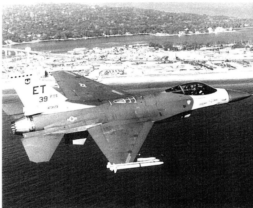
Le gouvernement croate a l'intention d'acquiescer à l'acquisition d'avions de combat F-16. Ici un F-16 A/B équipé du missile air-air ASRAAM.

Financées par l'Occident et le monde musulman, les forces armées croates et musulmano-croates de Bosnie-Herzégovine prendraient, non seulement un avantage qualitatif ; quantitativement, elles l'emporteraient également sur les forces yougoslaves.