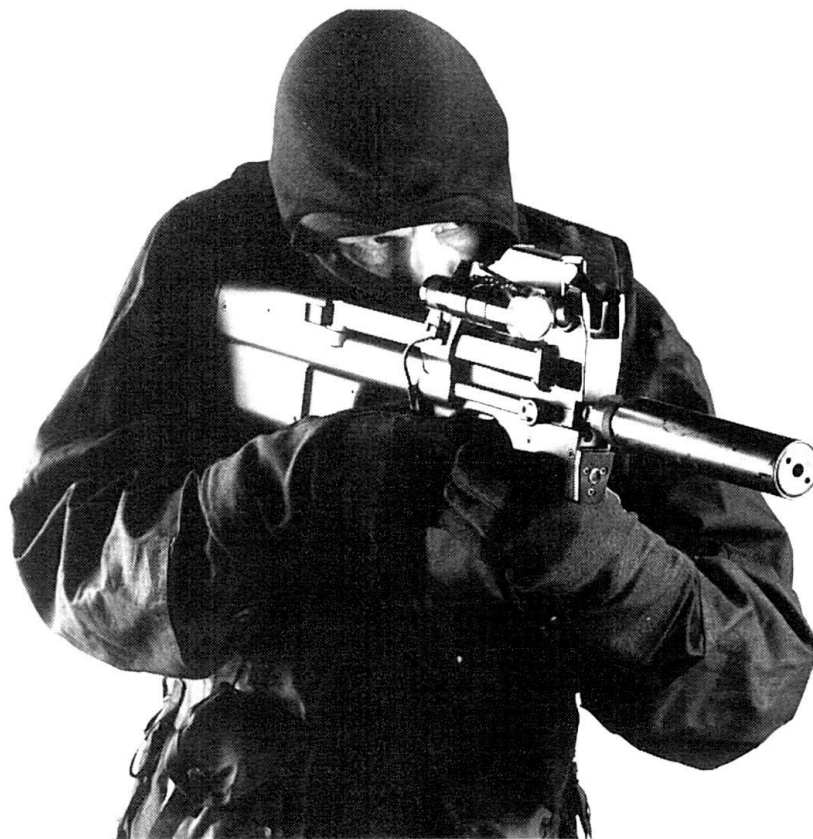
La diversité des accessoires et le faible encombrement de l'arme en font un outil apprécié des forces spéciales.

La première impression, l'arme en main, est sa remarquable ergonomie. Le changement de magasin, au sujet duquel nous avons précédemment émis quelques réserves 1 , s'effectue sans peine. La visée optique, très simple d'emploi, facilite l'usage en luminosité réduite. Quelques exercices de pointage et le système est acquis par le tireur. Il en va de même pour le démontage, moins de 20 secondes suffisant à séparer les trois groupes d'assemblage, soit 6 pièces en tout, plus le magasin.