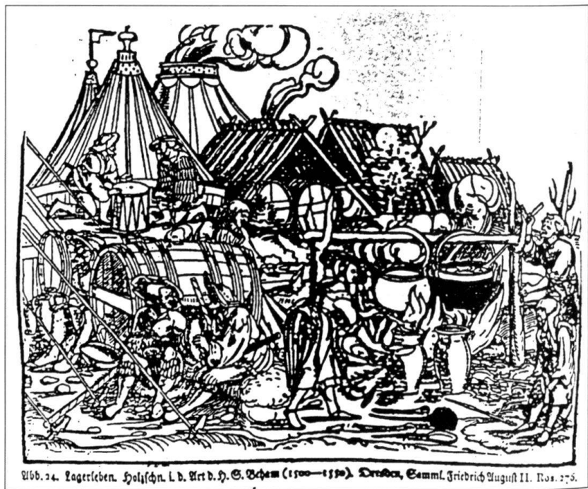
La vie au camp. Gravure sur bois, entre 1500 et 1550.