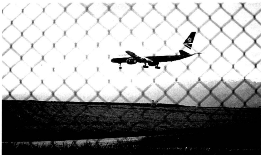
L'aéroport de Cointrin fait partie des soucis de la Division territoriale 1... (Photo : Caveng).

– le sous-chef d'état-major « Opérations » est res-