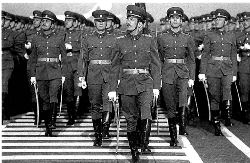
L'Armée Rouge, désormais partenaire de l'OTAN ? (Photo : Fernand Domange).

Parfois surnommée « la Suisse des Balkans » en rai-