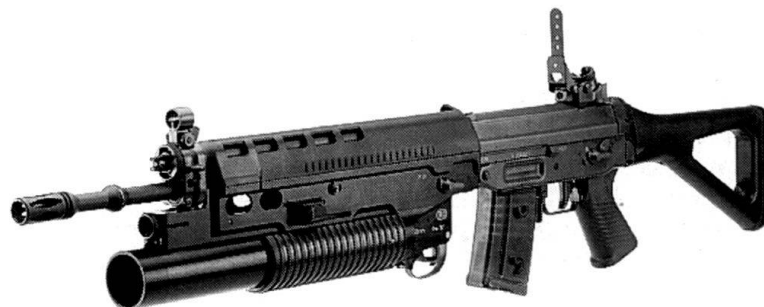
Lance-grenades 40 mm monté sur un Fusil d'assaut 90.