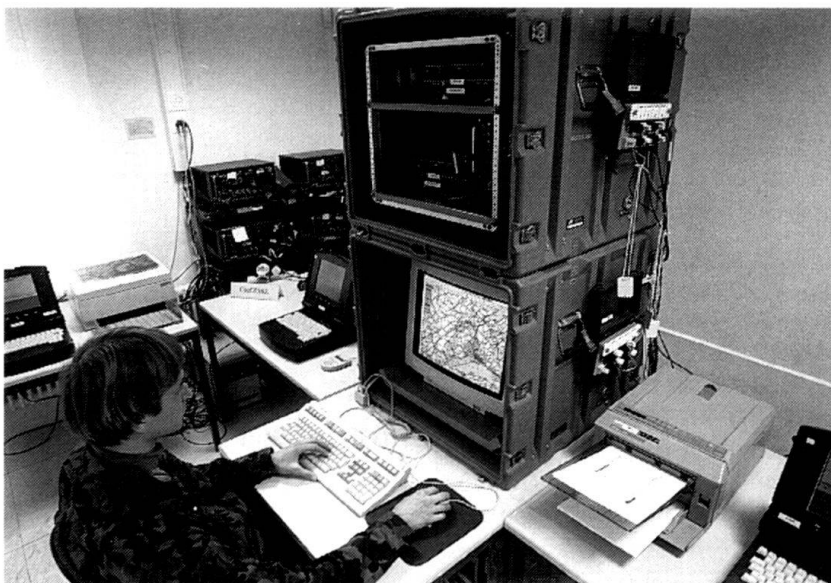
Systèmes intégrés de conduite et de direction des feux de l'artillerie INTAFF: places de travail au poste de commandement d'une Grande Unité.

En 1986, les Chambres accordaient un crédit de 941 millions pour des chasseurs de chars Mowag Piranha 6x6 , équipés d'engin guidés antichars TOW . La portée pratique de ce missile atteint 3500 m. Sa tête de guerre repose sur la technologie de la charge creuse. Le Dragon et le Panzer-