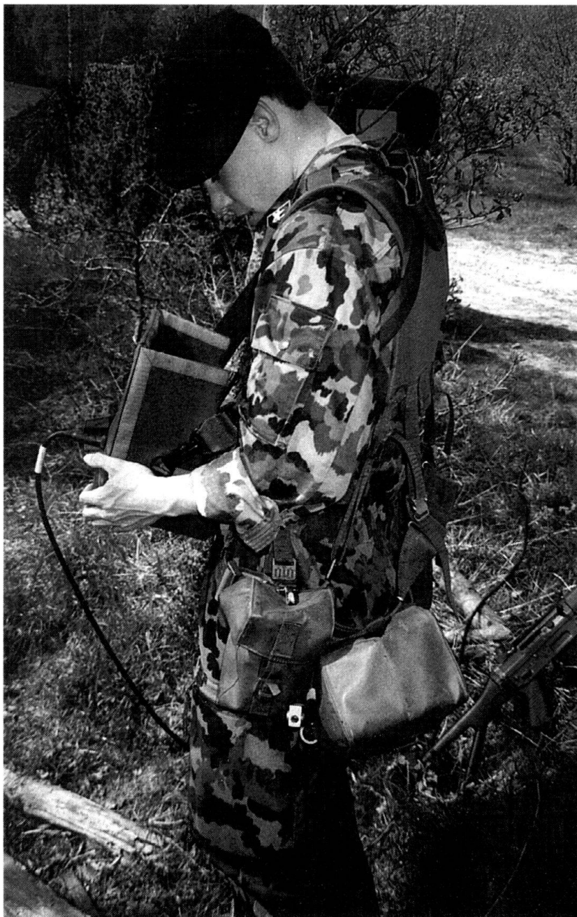
Systèmes intégrés de conduite et de direction des feux de l'artillerie INTAFF: commandant de tir d'artillerie avec unité de saisie portable.

Les programmes d'armement 1983 et 1991 avaient permis à l'artillerie de campagne et de forteresse de disposer de systèmes de direction des feux, qui ont fait leurs preuves, partant d'améliorer de manière notable la précision et l'efficacité de la conduite des feux. Les systèmes proposés se situent dans la même logique ; on les trouvera dans les organes de commandement supérieurs, où les méthodes actuelles, manuelles et lentes, céderont la place à une gestion des feux assistée par ordinateur. Le système aide également à la prise de décision et en accélère le processus.