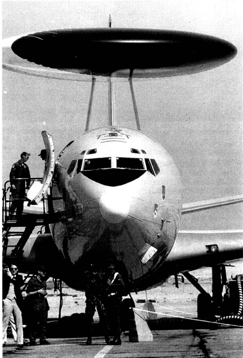
Dans les années qui viennent, la Suisse sera-t-elle amenée à participer à un réseau d'alerte au niveau du continent ? Ici, un AWACS.

tégique. Cette logique est raisonnable, car la sécurité européenne se jouera dorénavant, pour l'essentiel, sur des théâtres extérieurs. Or, aucune nation européenne ne sera jamais plus en mesure de projeter, indépendamment, suffisamment de forces pour défendre les intérêts du continent.