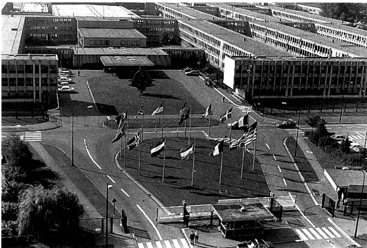
La neutralité, même revue, est-elle compatible avec une adhésion de la Suisse à l'OTAN ?

De plus, pour garantir à long terme ses intérêts spécifiques, l'Europe doit pouvoir compter sur un instrument de dissuasion nucléaire, largement indépendant des structures de l'Organisation atlantique. L'intégration militaire et la force de frappe constituent donc les conditions incontournables de la sécurité continentale. Ces deux conditions sont incompatibles avec la notion de neutralité.