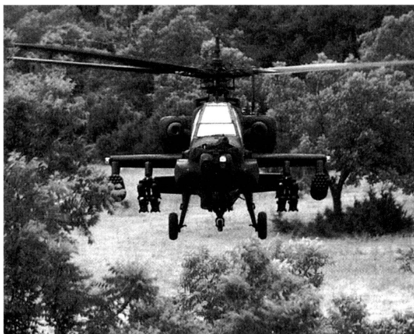
L'hélicoptère Apache AH-64D.

■ Le système Asrad , développé en prévision d'engagements