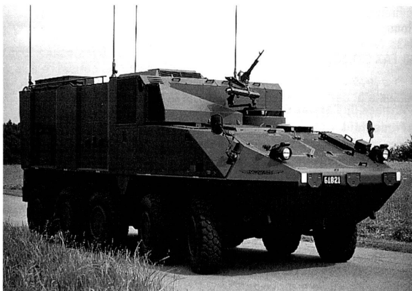
Le véhicule de commandement Mowag a été livré à l'artillerie côtière suédoise à fin juin dernier.

■ Le 13 juin, à Bruxelles, lors de la rencontre des ministres de la Défense des pays membres de l'OTAN et de leurs homologues du Partenariat pour la paix (PPP), la Suisse était représentée par le chef du DMF. Cinq jours plus tard, le conseiller fédéral Ogi s'est à nouveau rendu dans la capitale belge pour y sceller formellement l'acceptation mutuelle, par la Suisse et par l'OTAN, du