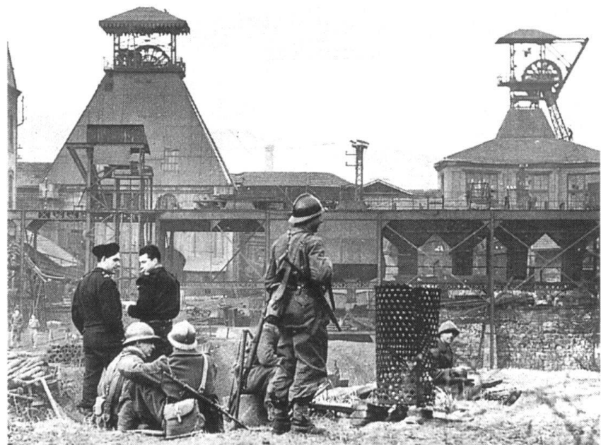
L'armée remplace les CRS en 1997. L'armée sur le carreau de la mine. Le gouvernement a dissous onze compagnies républicaines de sécurité complices des émeutiers.