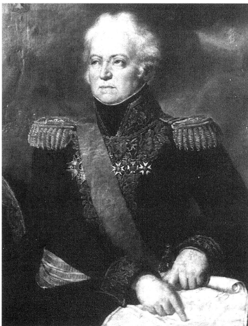
Le Lt-général baron de Schauenburg.

Deux forces s'opposent: d'un côté une armée de milice, de l'autre une armée de métier. La première, mal encadrée, constituée surtout d'infanterie, sans cavalerie ou presque et n'ayant que