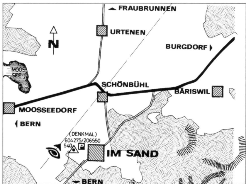
Croquis du terrain de la bataille du Grauholz.

Schauenburg atteint la rive Nord du lac de Biemme et de l'Aar, faisant face aux Bernois et aux Soleurois à Longeau, Büren et Nidau. Les échanges d'invectives sont fréquentes entre soldats des deux camps, donnant l'occasion aux officiers de sanctionner ces abus, «non conformes à l'honnêteté qui doit régner entre des militaires». Le 23 février, Schauenburg reçoit un ordre indiquant qu'il doit se tenir prêt à attaquer le 28 février au petit matin ce qui, selon lui, peut être exécuté sans problème.