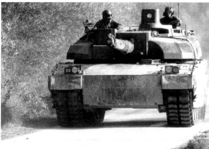
Le Leclerc est le premier char à avoir reçu un blindage en partie structurel et en partie remplaçable.

L'avenir dans ce domaine passe cependant par la réalisation de systèmes de filtration polyvalents – car efficaces face à une gamme plus étendue de toxiques – et régénérables, dans lesquels il