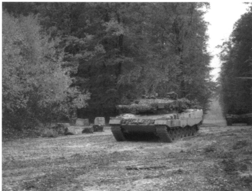
Progression d'une section Leopard-2 sur une piste de Bure.