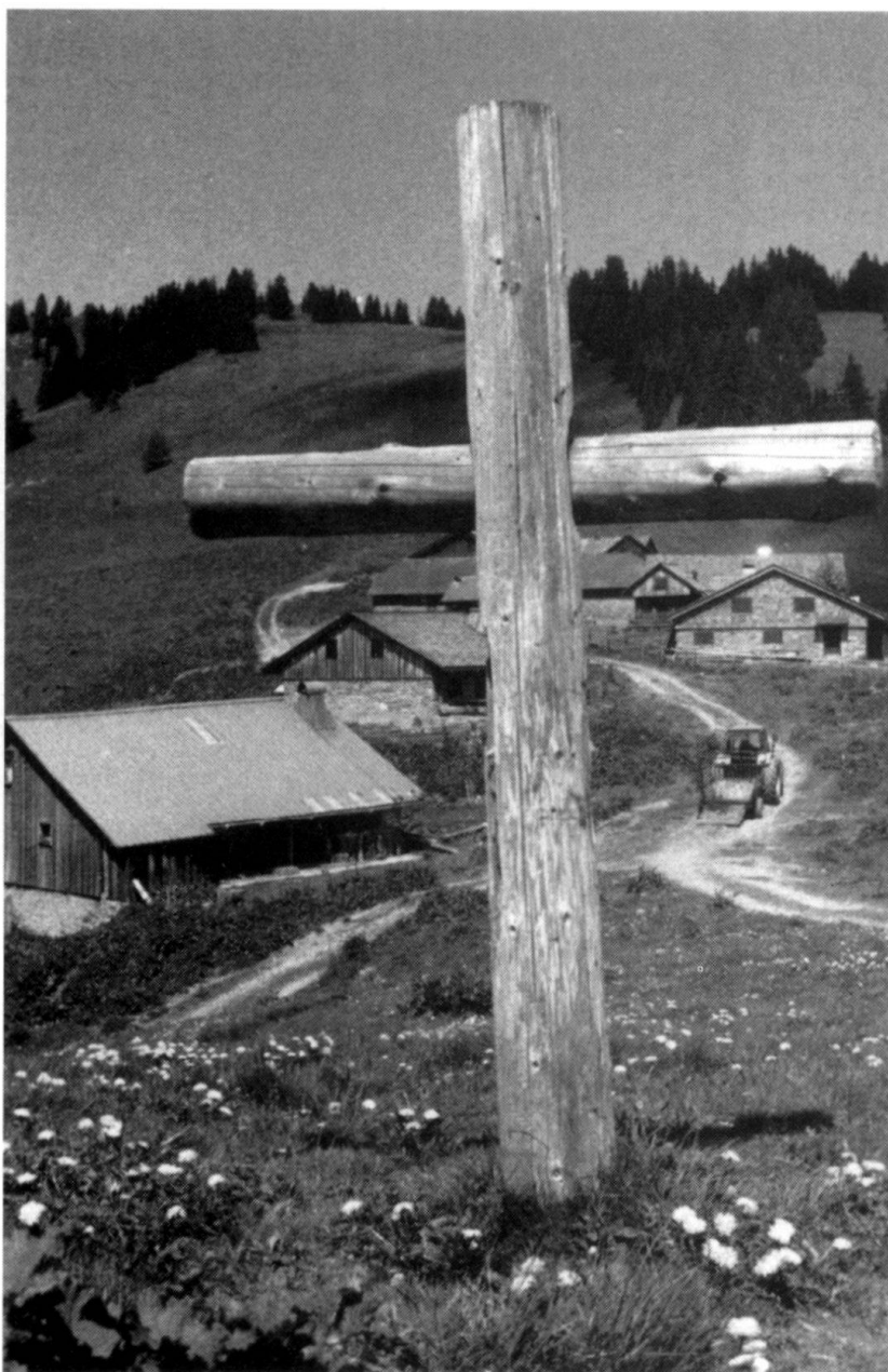
Si la spiritualité et la religion semblent bien oubliées dans les sociétés contemporaines...

Nous avons quitté l'époque où l'ecclésiastique savait tout et pouvait tout faire de ce qu'exige la vie chrétienne. La fragmentation des secteurs de connaissance et d'action, la complexification sociale obligent les ecclésiastiques à préciser l'orientation de leur vocation et à acquérir des compétences particulières. Au point